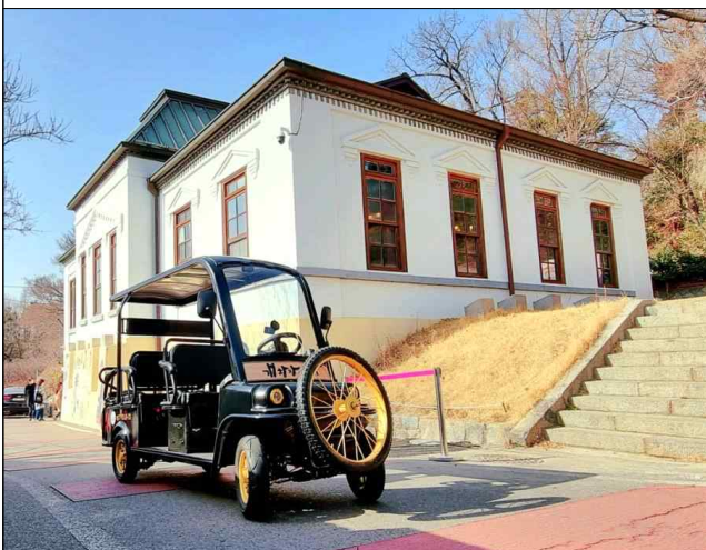
문화유산 답사(전동카트 탑승)