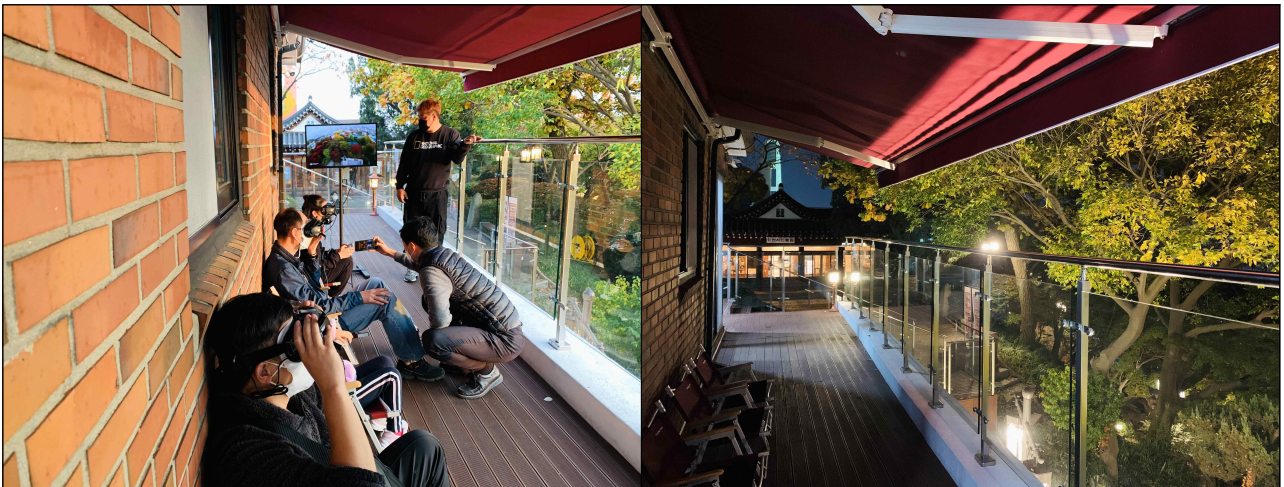
FPV 드론 투어(인천시민애집 역사전망대)