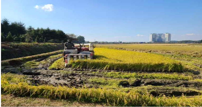
2021년 연희공원 자연마당 쌀 수확 (2021.10.23.)