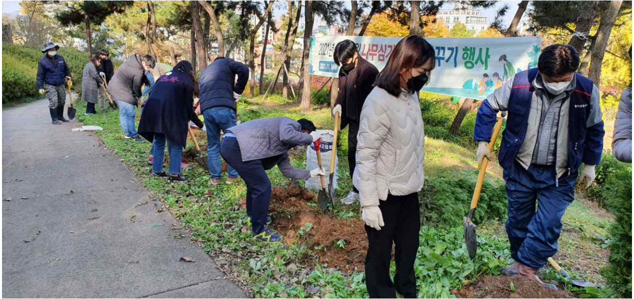
월미공원 나무심기 및 숲 가꾸기 행사 개최사진