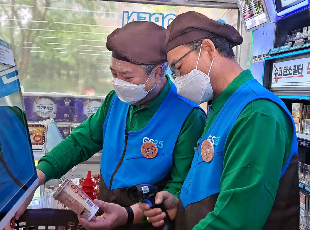
은퇴 어르신 채용 시니어드림스토어(인천1호점)