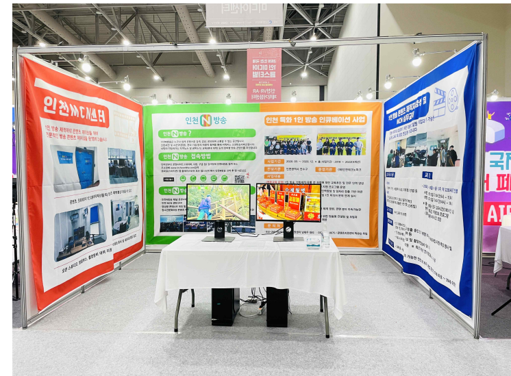
<2020년 홍보부스 사진>

김경아 시 문화콘텐츠과장은 “이번 행사에서 시민참여형 영상 공유플랫폼인 인천N방송을 홍보하고 이를 계기로 시민들의 1인미디어 콘텐츠 참여기회가 더욱 확대될 수 있도록 노력하겠다”라고 말했다.