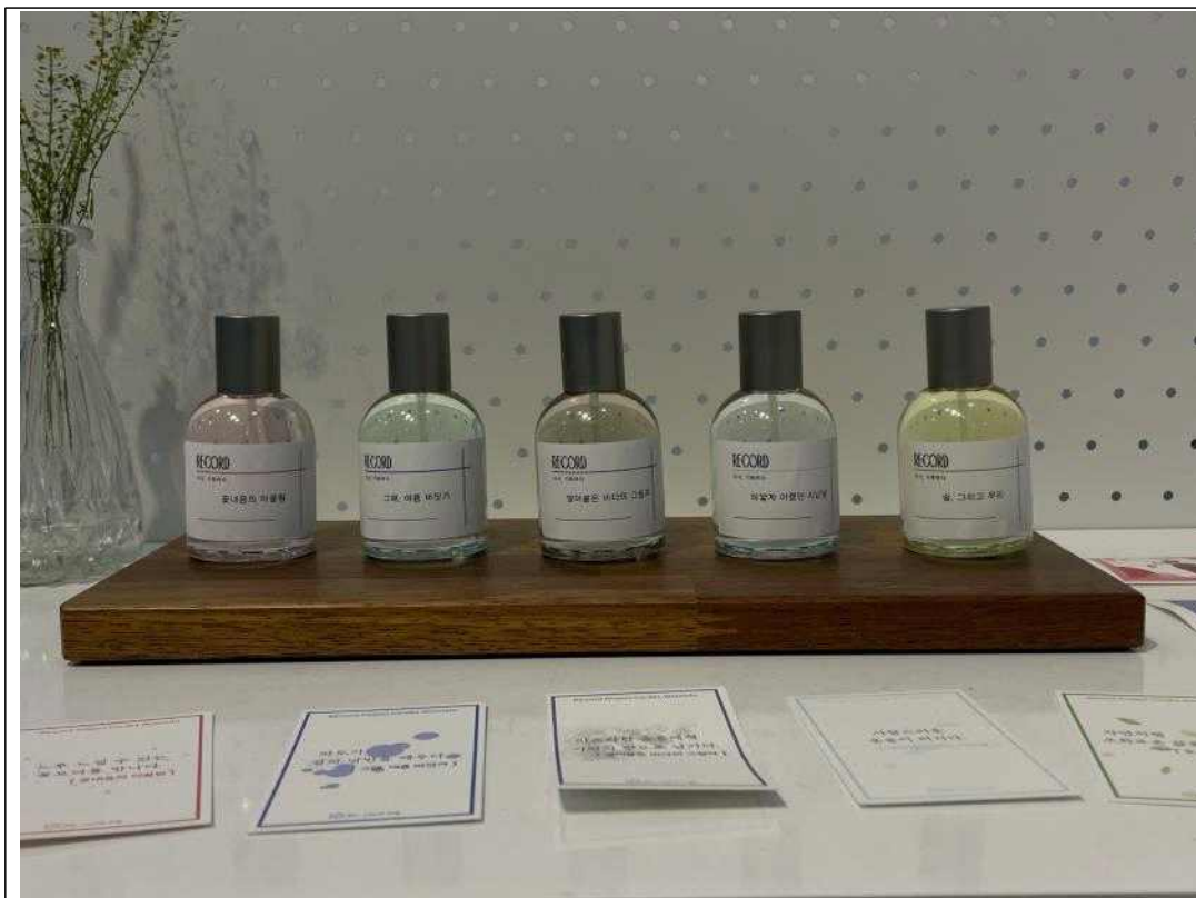
월 미 도 를 담은 향수 5종