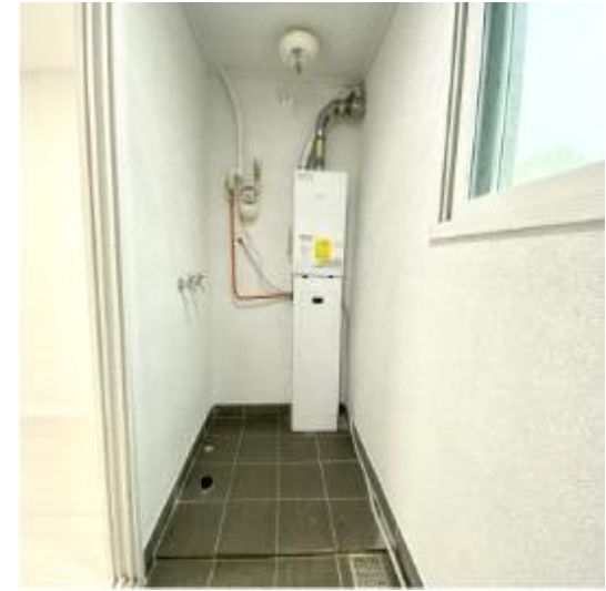
매입임대주택 거실+방+보일러실 사진모음