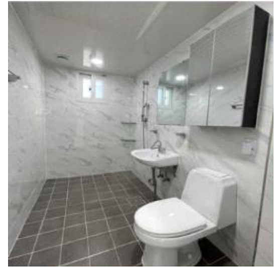
매입임대주택 화장실 사진모음