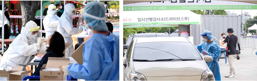
< 연수구 임시 선별검사소, 서구 아시아드 주경기장 임시 선별검사소 사진 >