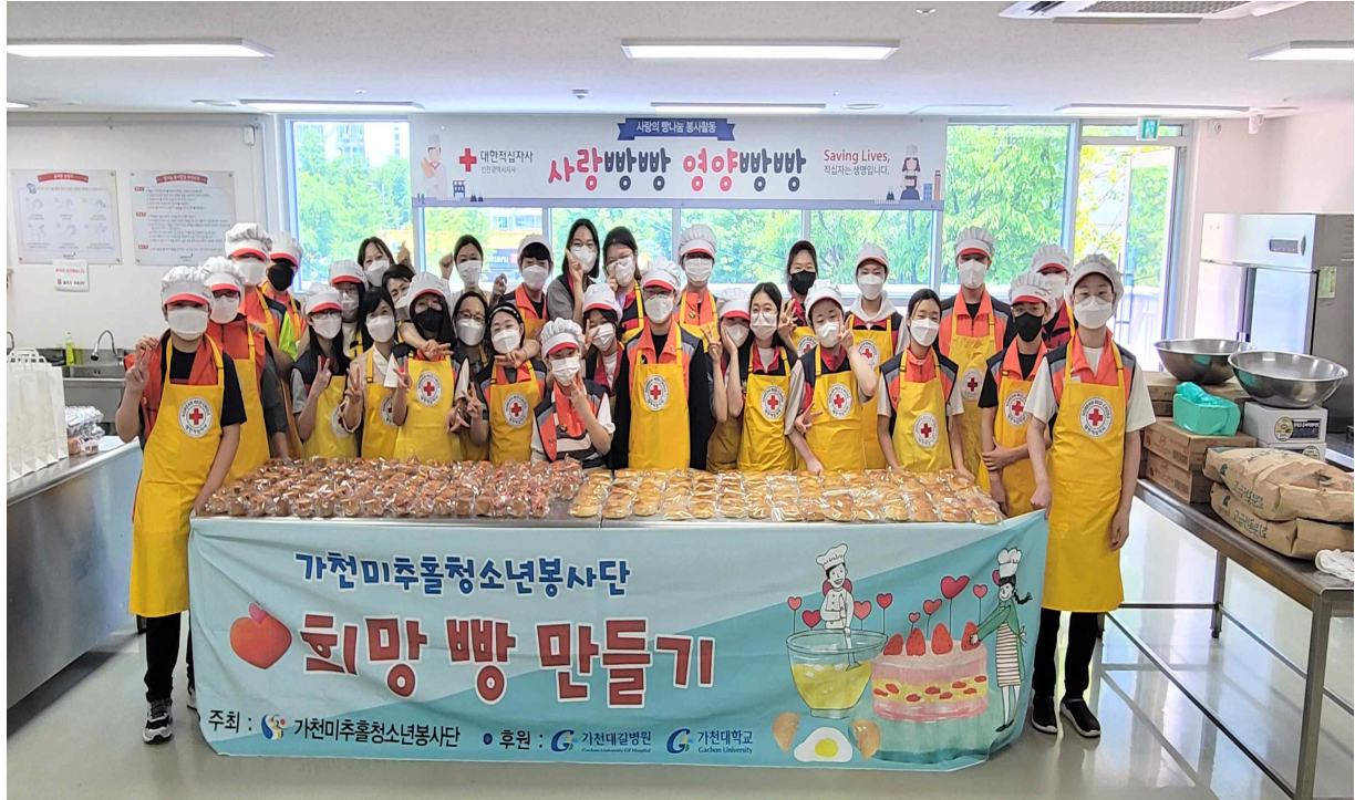
<가천미추홀청소년봉사단 희망 빵 만들기 행사>