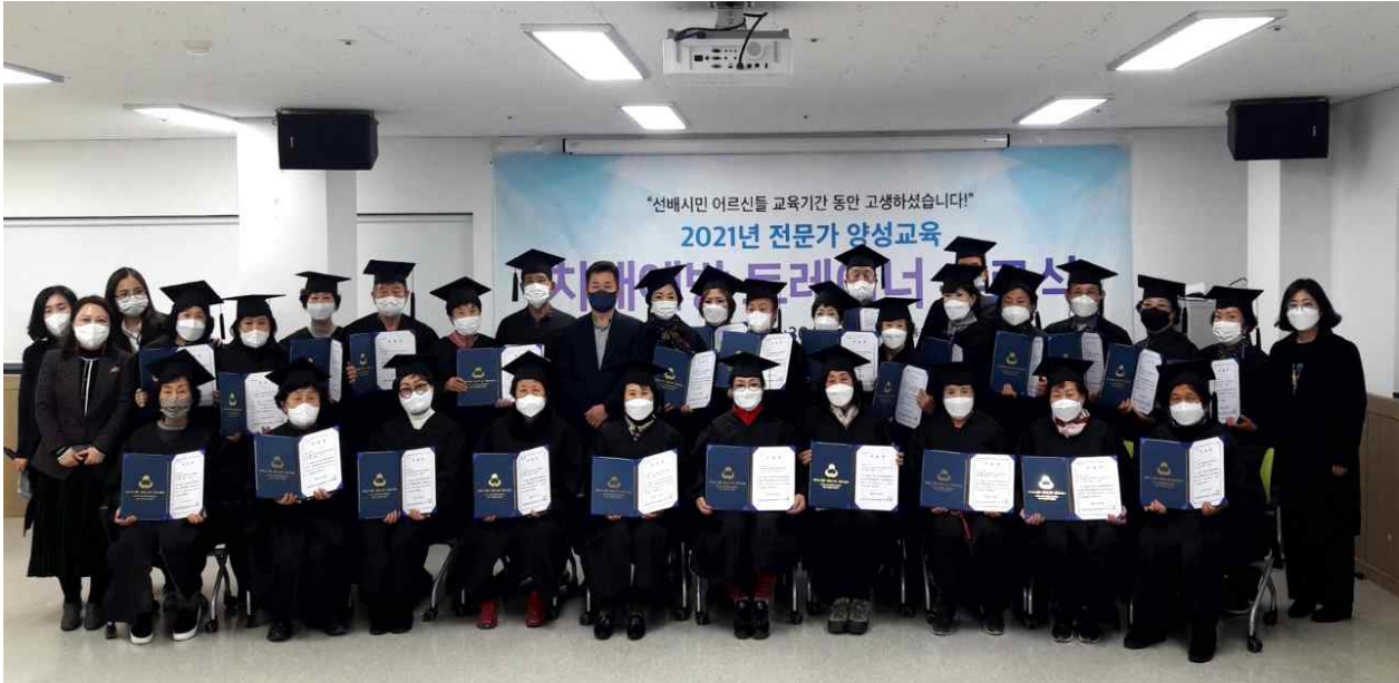
< 동구 노인인력개발센터 '치매예방트레이너 전문가 양성교육' 과정 >