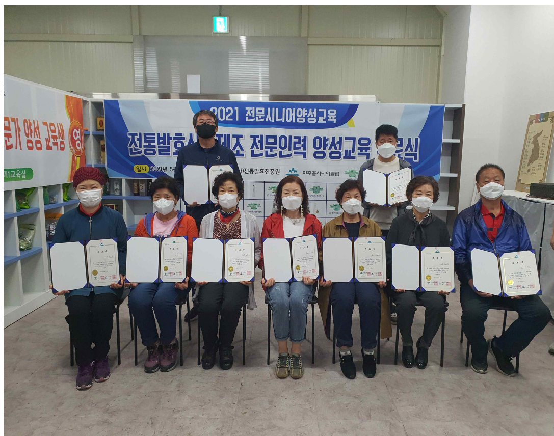
< 미추홀시니어클럽의 '전통 발효식품 제조전문가 양성 교육' 과정 >