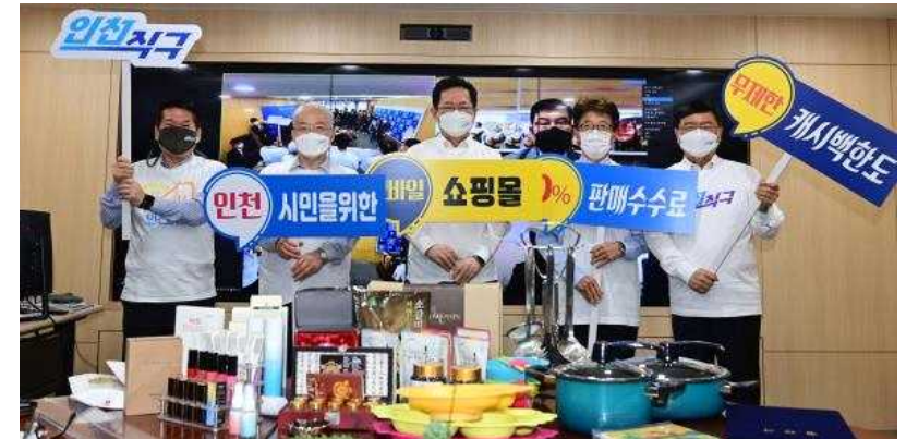
<2021년 4월 19일 시청 접견실에서 열린 '인천자구' 출범식 및 업무협약식에서 협약서 사명 후 기념촬영을 하고 있다.>