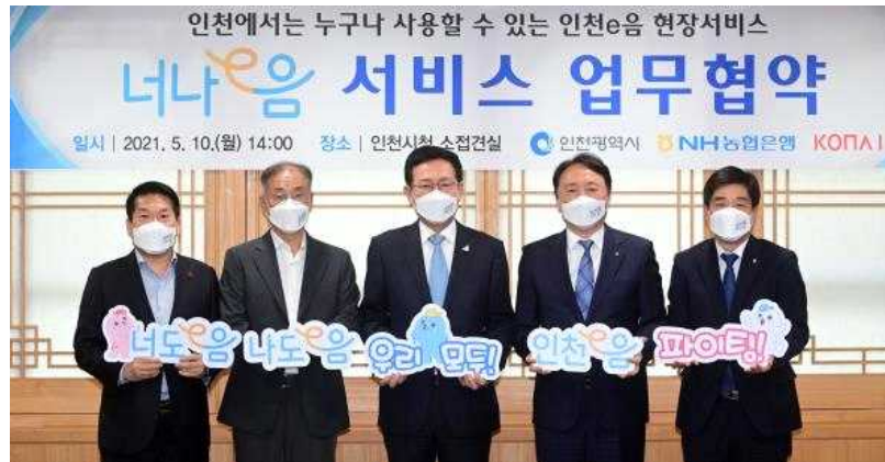
<2021년 5월 10일 시청 접견실에서 열린 '너나e음 서비스 업무협약' 체결 후 기념촬영을 하고 있다.>