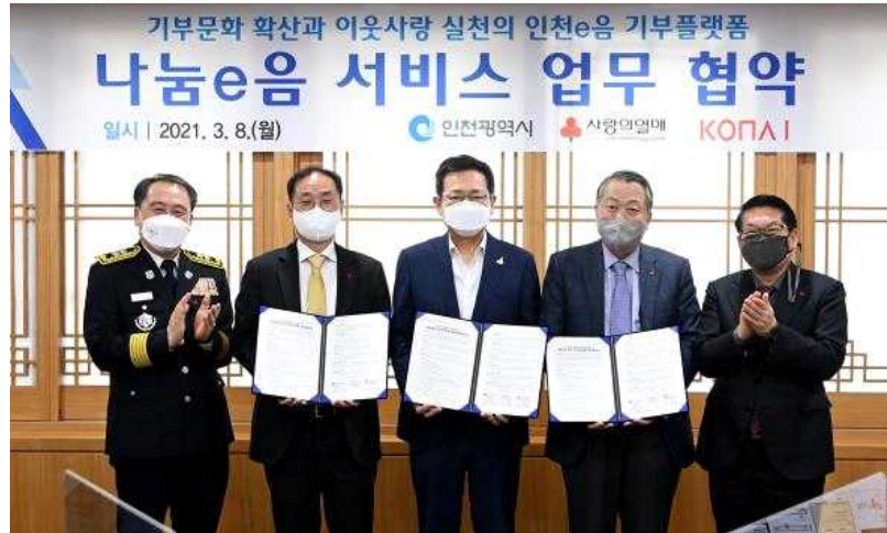
<2021년 3월 8일 시청 접견실에서 열린 '나눔e음 서비스 업무협약' 체결 후 기념촬영을 하고 있다.>