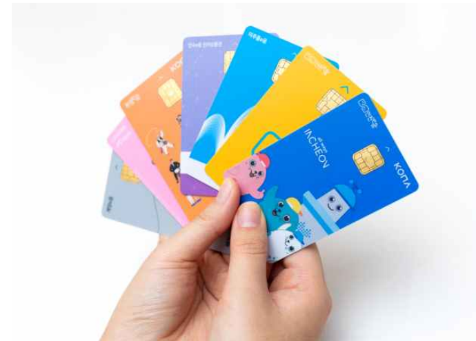
<인천 e음카드 이미지>