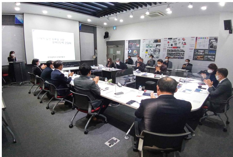
< ‘21.11.11. 단계적 일상회복을 위한 경제인단체 간담회’ >