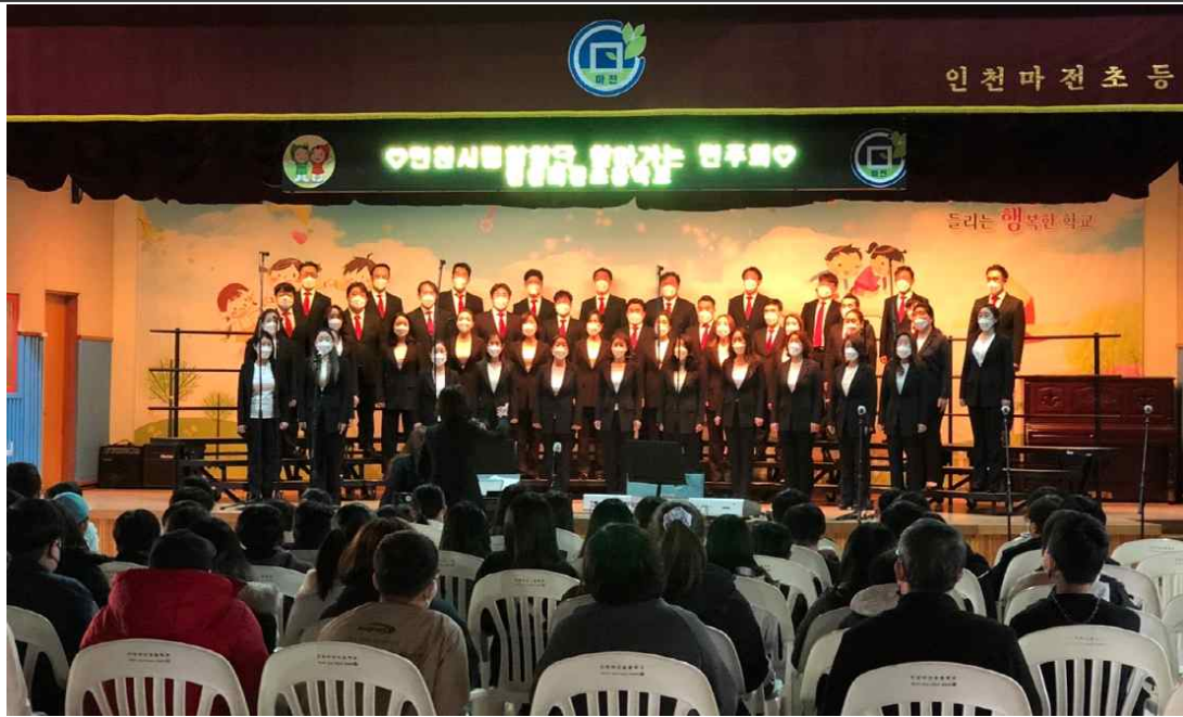
찾아가는 공연 사진