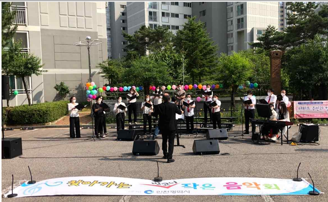
찾아가는 공연 사진