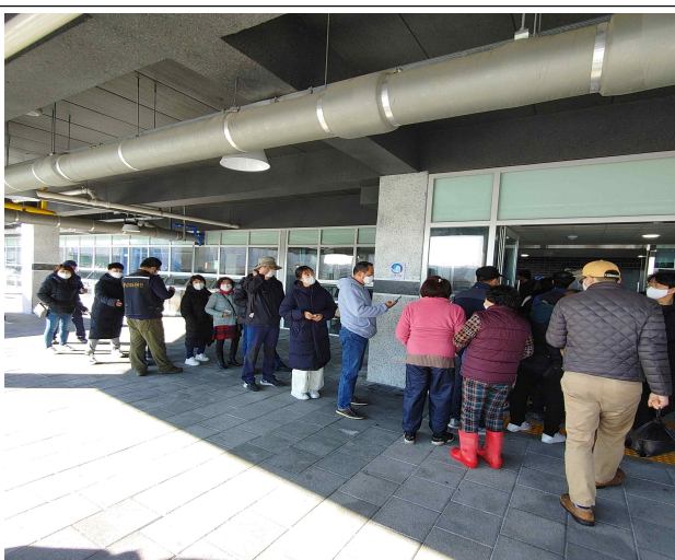
전통시장 온누리상품권 지급행사