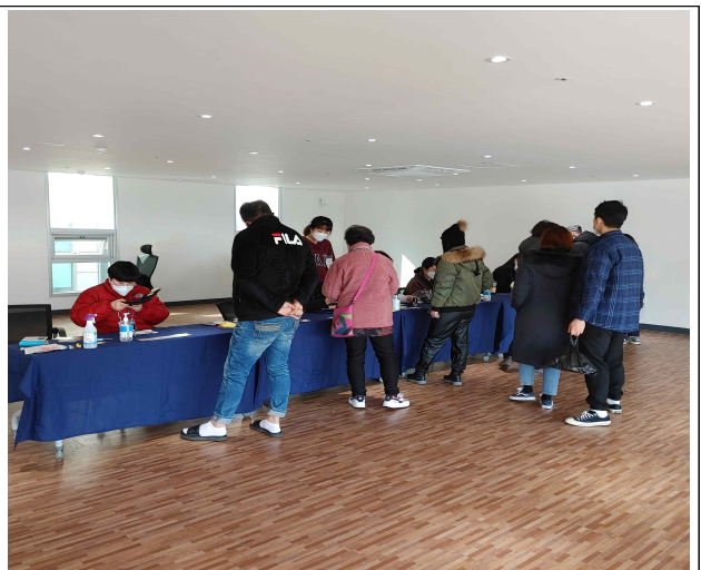
전통시장 온누리상품권 지급행사