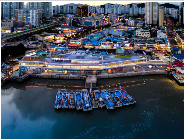
소래포구 전통어시장 전경