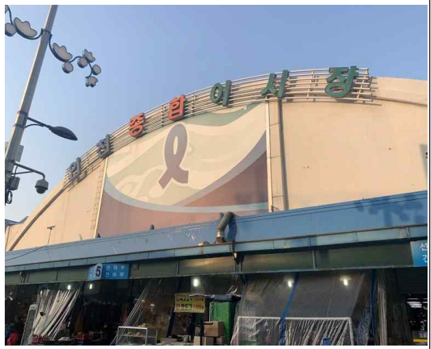
연안부두 인천종합어시장 전경