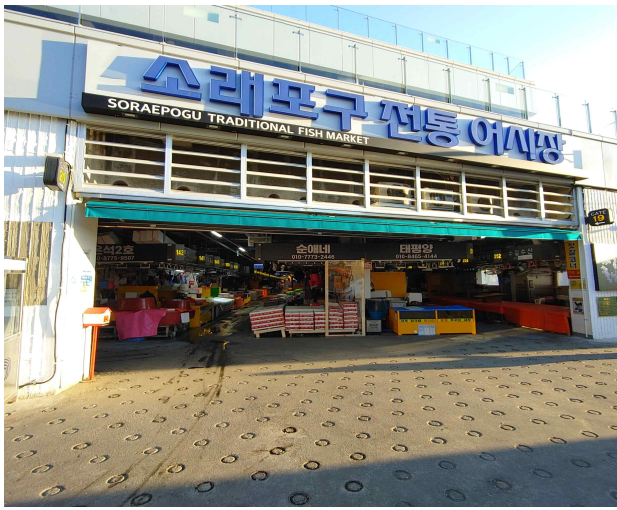
소래포구 전통어시장 전경