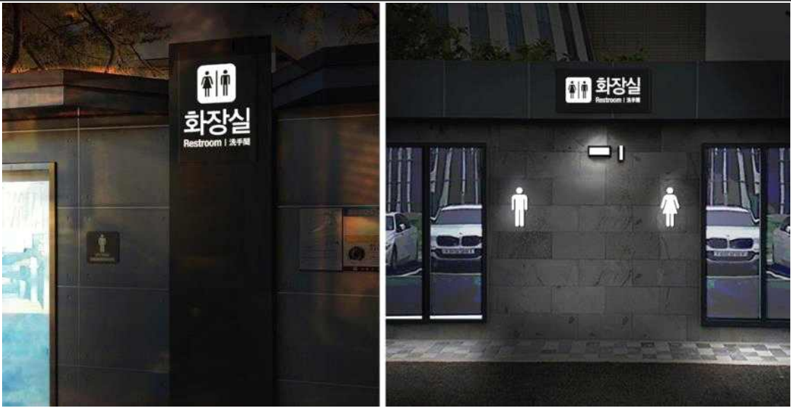
화장실 안내사인 디자인 가이드라인 예시 이미지