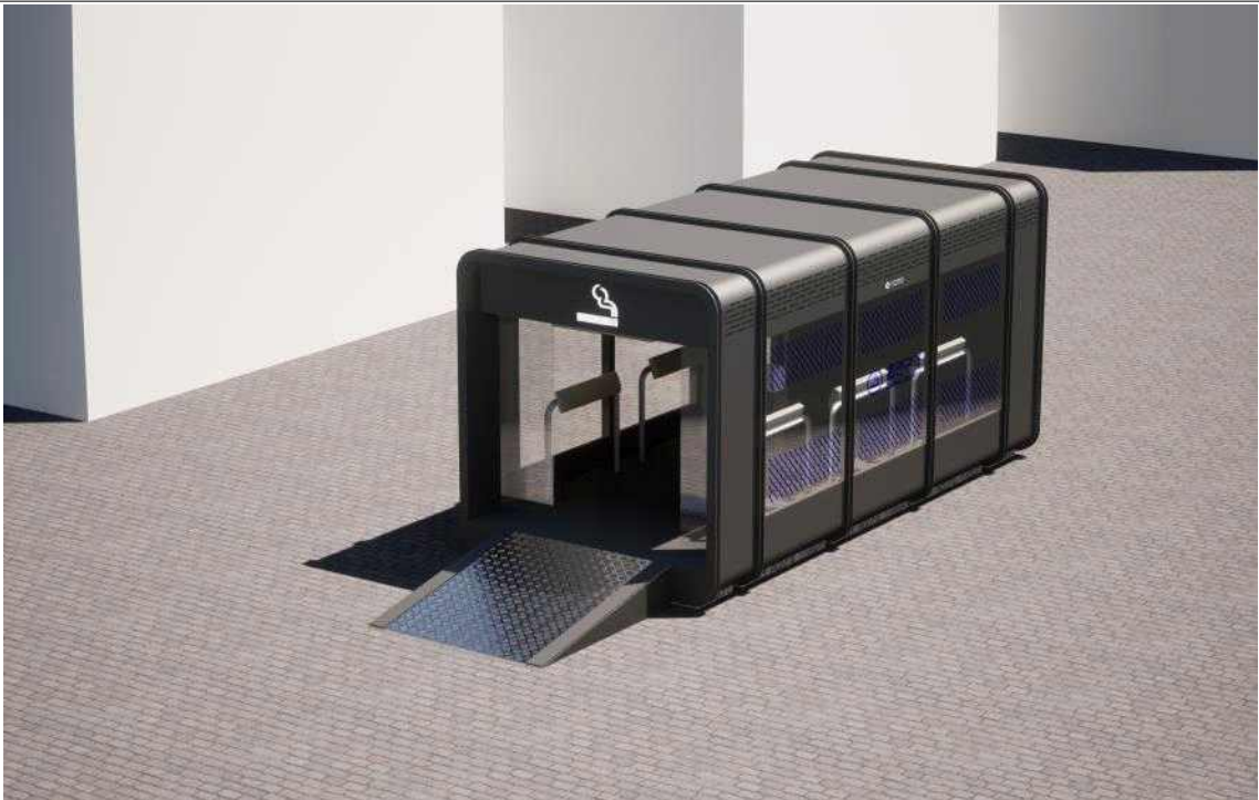
민간용 흡연부스 디자인 가이드라인 예시 이미지