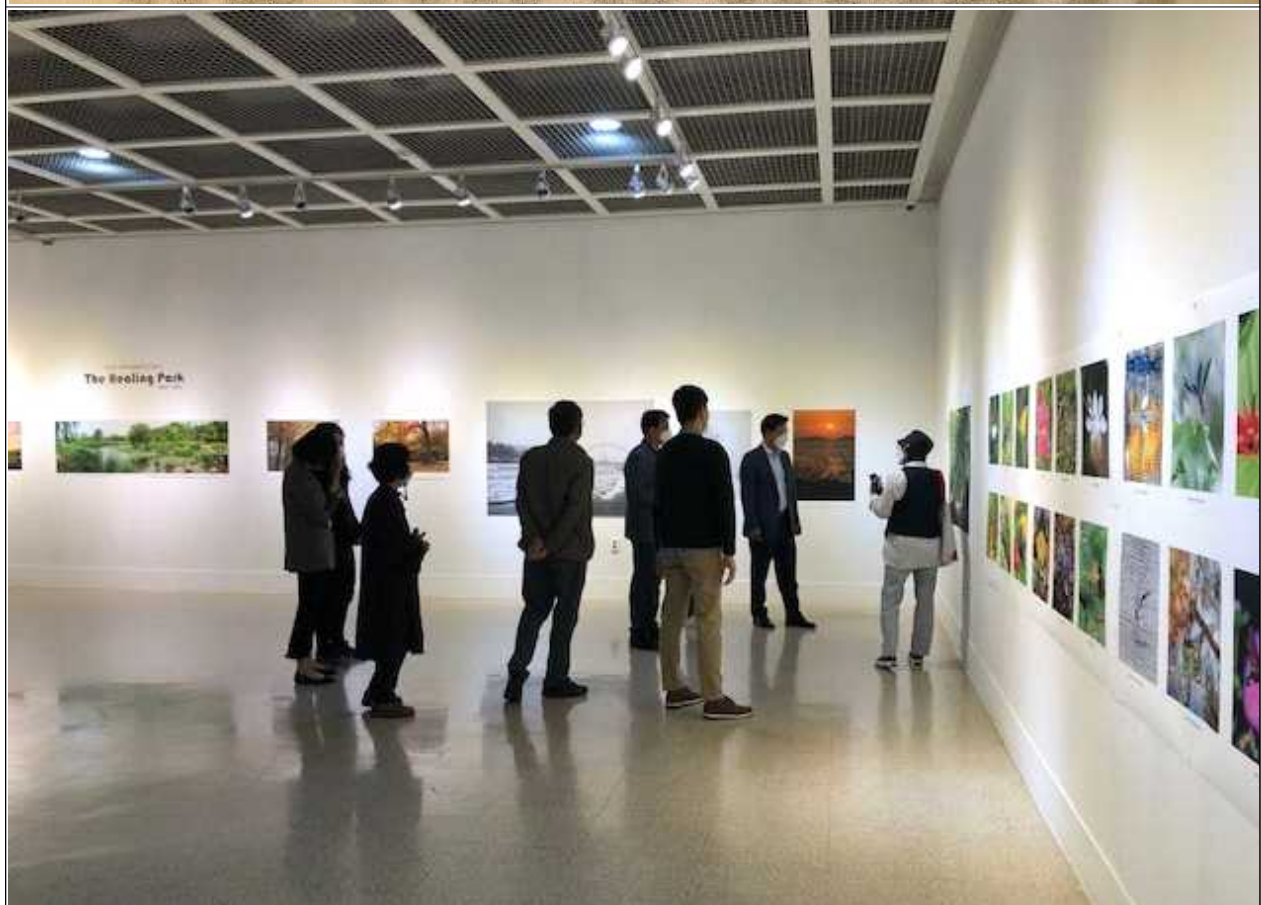
제4회 전시회, 인천문화예술회관 소·중전시실 ('21.10.16.~10.21.)