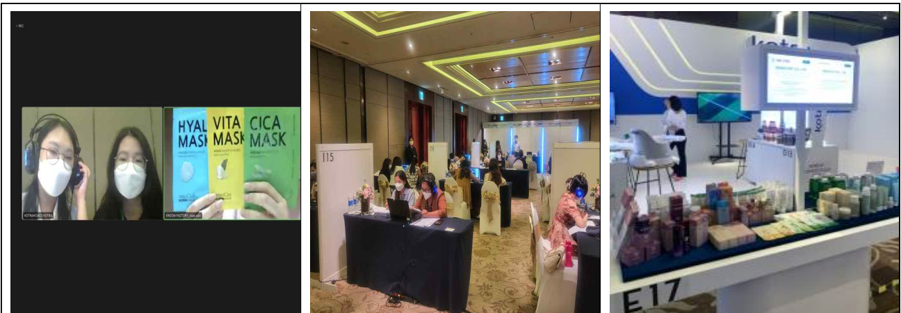
하이브리드 상담 <현지상담장(바이어,통역), 인천기업, 수행기관>