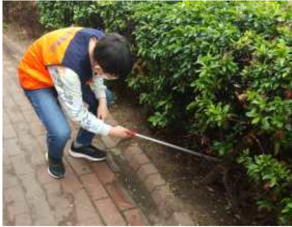
■ 가로수 지킴이 활동 사진 ■