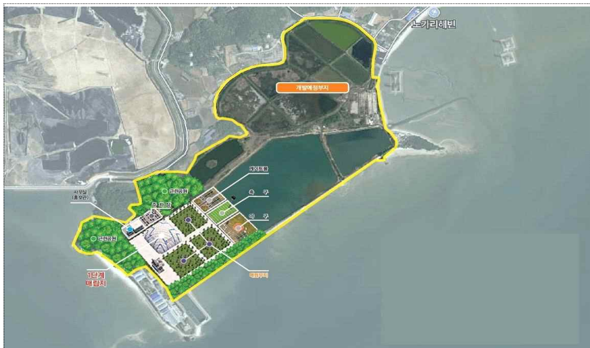
부지 개발 개요도