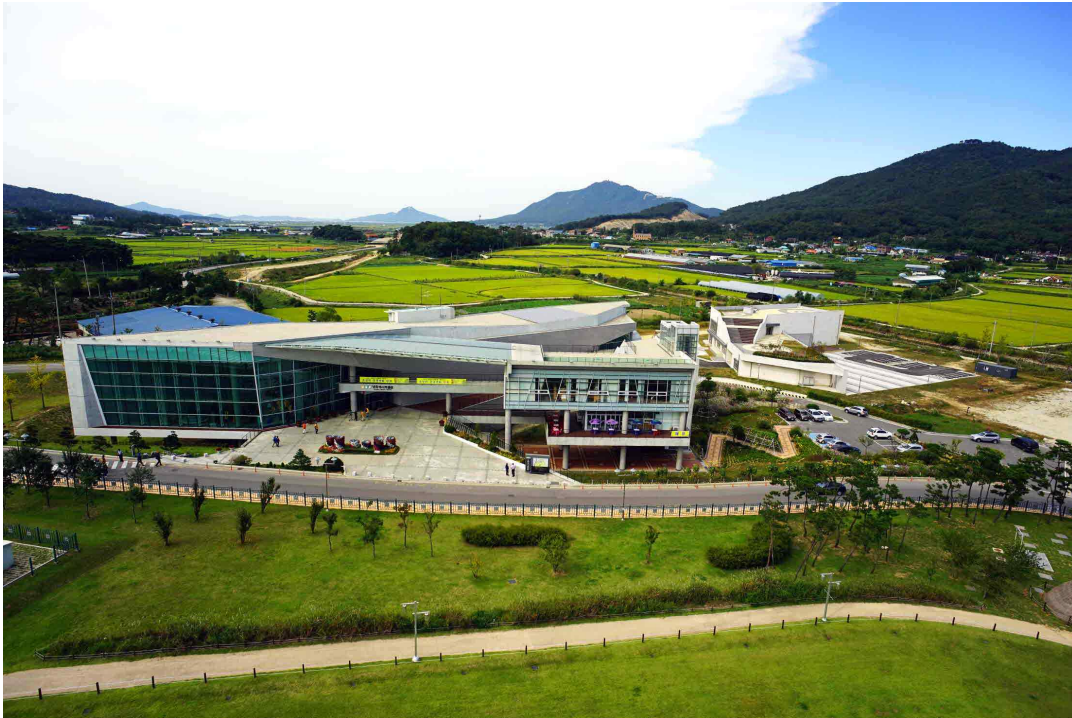
강화 역사박물관 전경