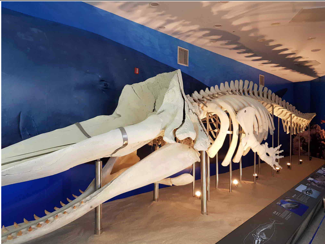
강화 자연사박물관 로비 향유고래 뼈 모형