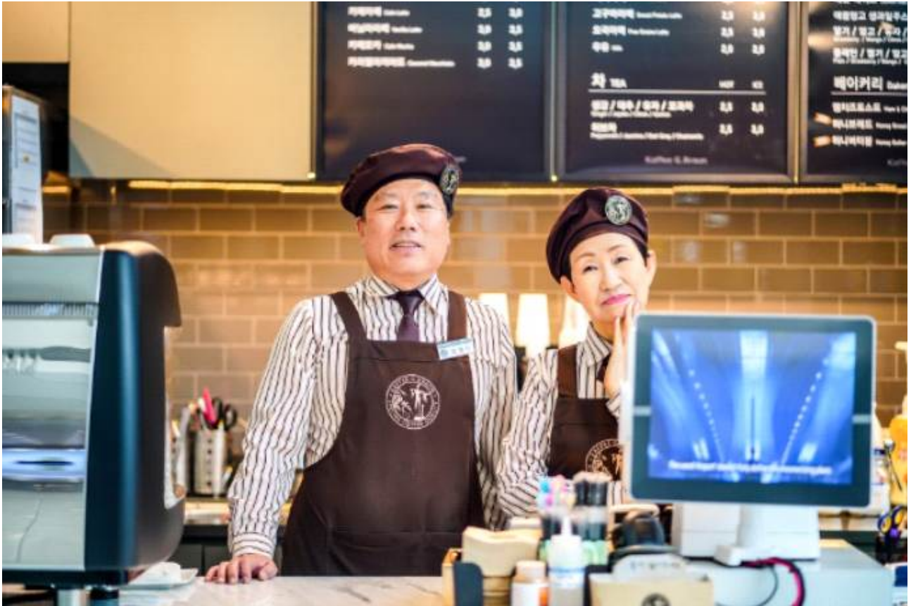
시니어 카페 운영 어르신 일자리