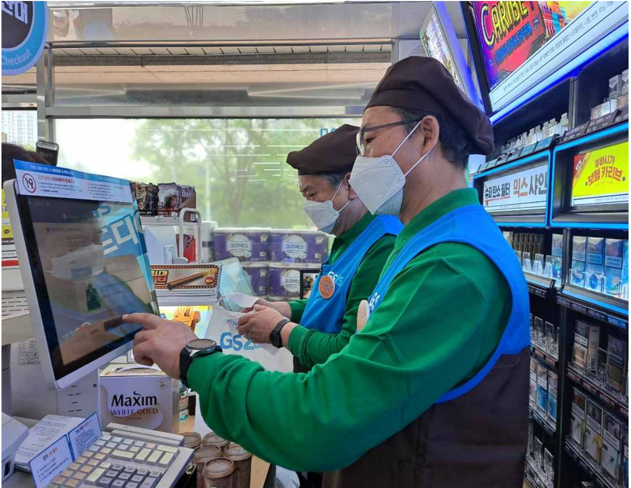
은퇴 어르신 채용 시니어드림스토어(인천1호점)