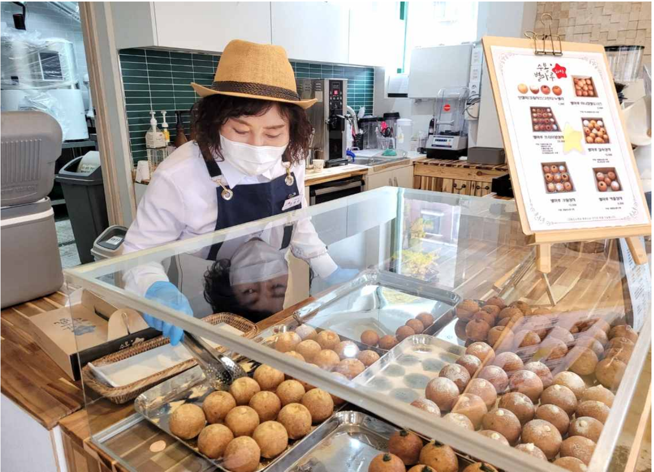
수봉별마루 도너츠 매장에서 근무하고 계신 어르신