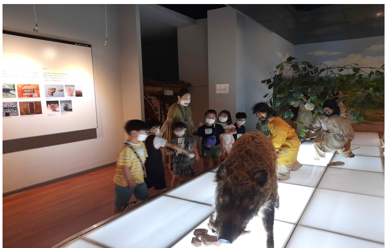
선사랑 놀자! - 상설 전시 설명