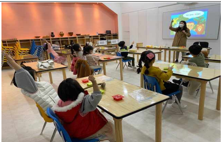
꼭꼭 숨어라 동물들아 - 비누 만들기