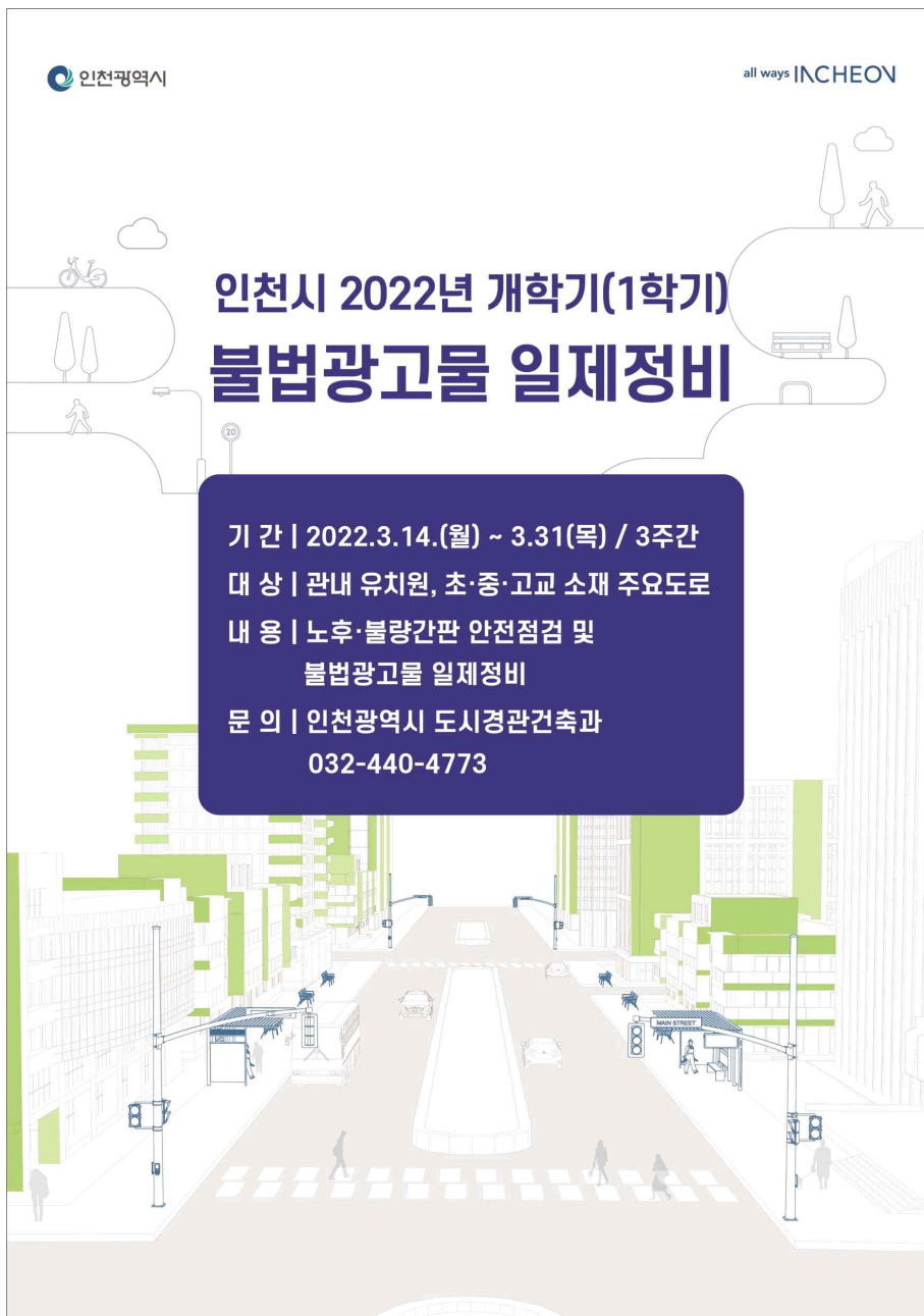
[사진] 인천시 2022년 불법광고물 일제정비 포스터

한편, 인천시는 행정부시장 주재로 가로경관TF 운영, 불법 광고물 정비 를 위한 주민 참여 수거보상제 및 자동전화안내서비스 시행, 노후 간판 정비를 위해 관련 예산을 군·구에 교부하는 등 깨끗한 도시환 경 조성에 다각적인 노력을 기울이고 있다.