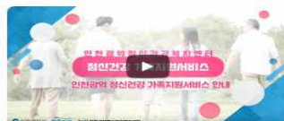
인천광역 정신건강 가족지원서비스 이용경험담