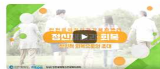
전인적 회복으로의 초대 01