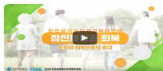
전인적 회복으로의 초대 02