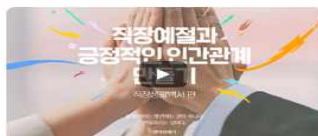
직장에질과 긍정적인 인간관계 만들기