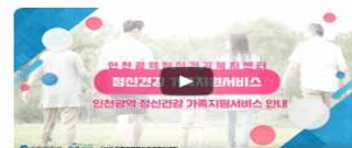
인천광역 정신건강 가족지원서비스 안내