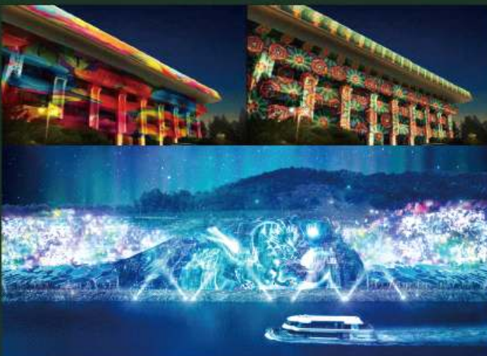
미디어아트 경관 계획 인천광역시청(위) | 경인아라뱃길(아래)