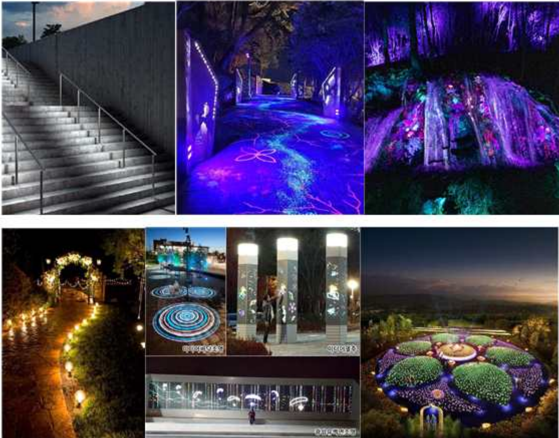
<붙임 2> 중구 자유공원 및 개항장 야간 명소 연출(예시)