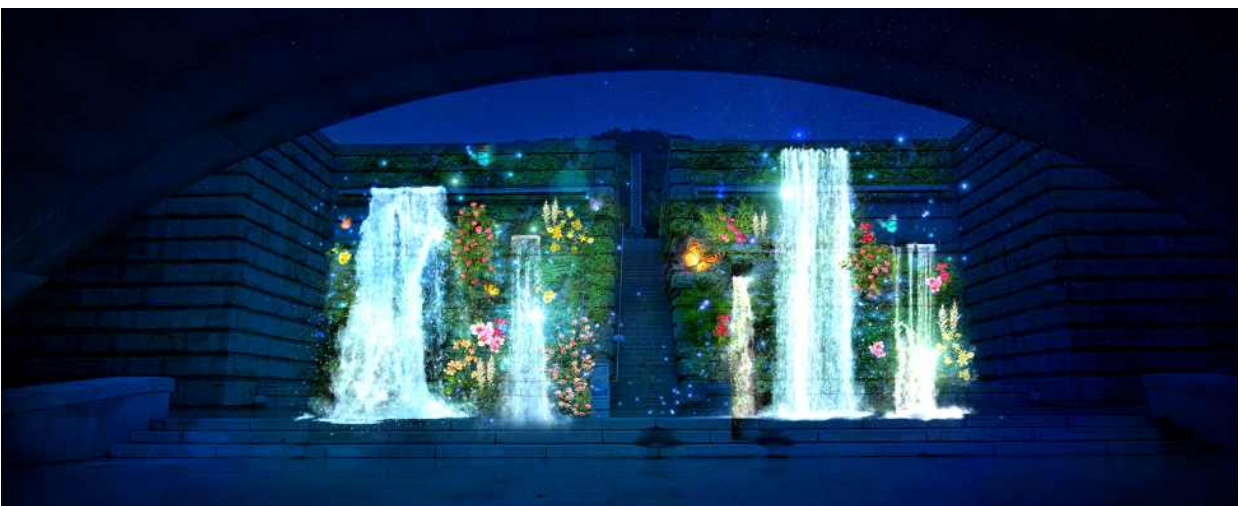
<붙임 3> 연수구 인천상륙작전기념관 위치도 및 야간 명소 연출(예시)