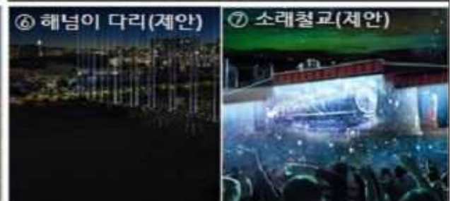
<붙임 1> 남동구 소래포구 ~ 해오름광장 야간 명소 연출 계획