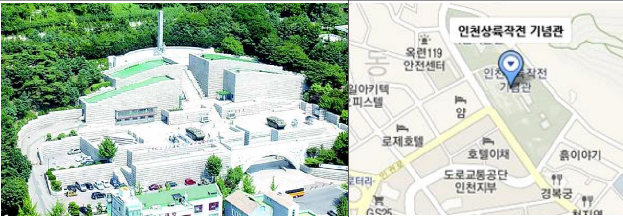
- 인천상륙작전기념관 (인천시 연수구 청량로 138)