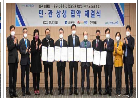
민·관 상생협약 체결식-중구(2022. 1. 3.)