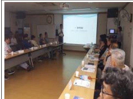
금창동 주민자치위원회 설명회(2019.08.06.)