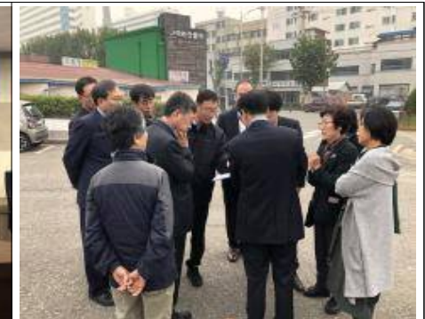
제2차 민관협의회 현장실사(2018.11.06)