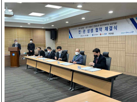
민·관 상생협약 체결식-중구(2022. 1. 3.)