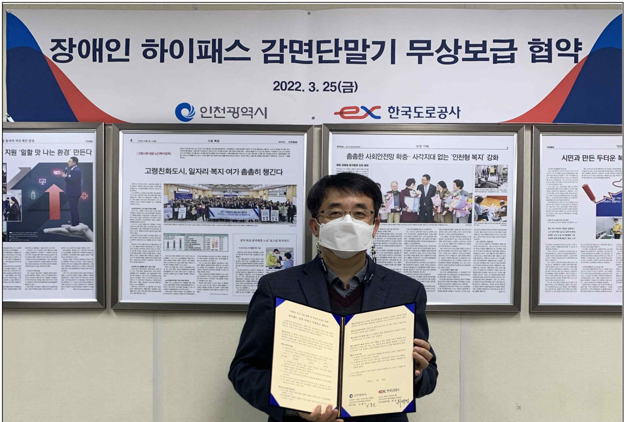
김충진 인천광역시 복지국장