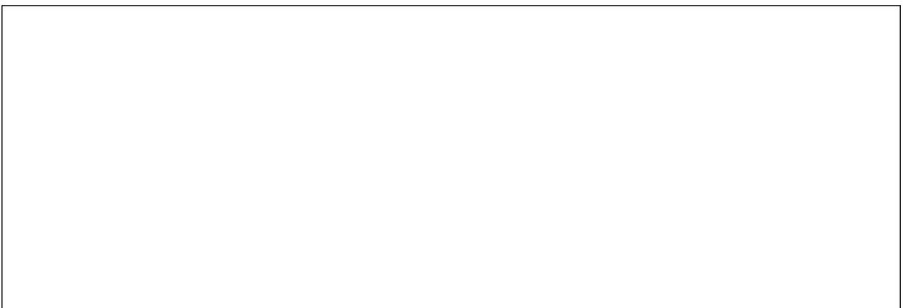
2022년 도 장애인 하이패스 감면단말기 구입지원 사업 홍보 포스터