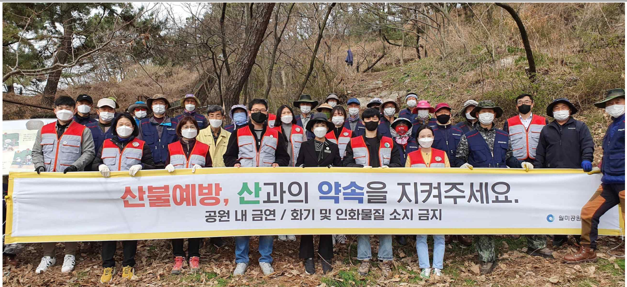
월미공원 산불방지 홍보캠페인 현황사진