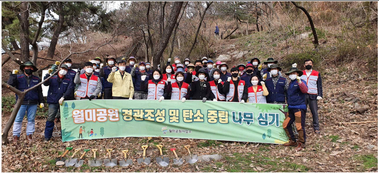
월미공원 식목일 나무심기 행사 개최사진