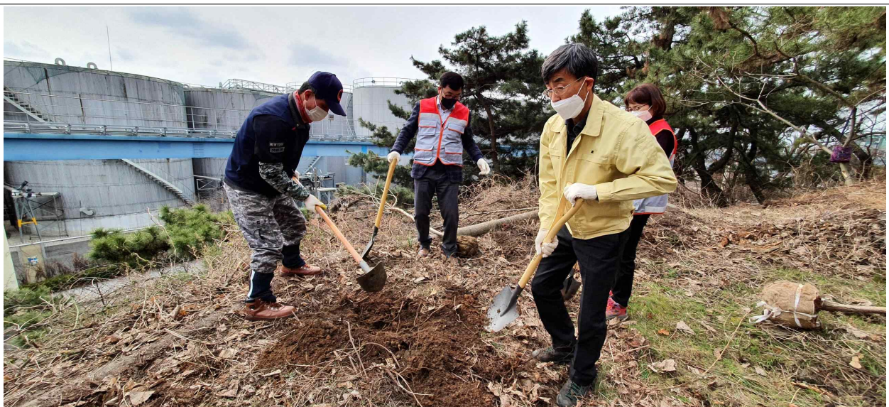
월미공원 식목일 나무심기 현황사진