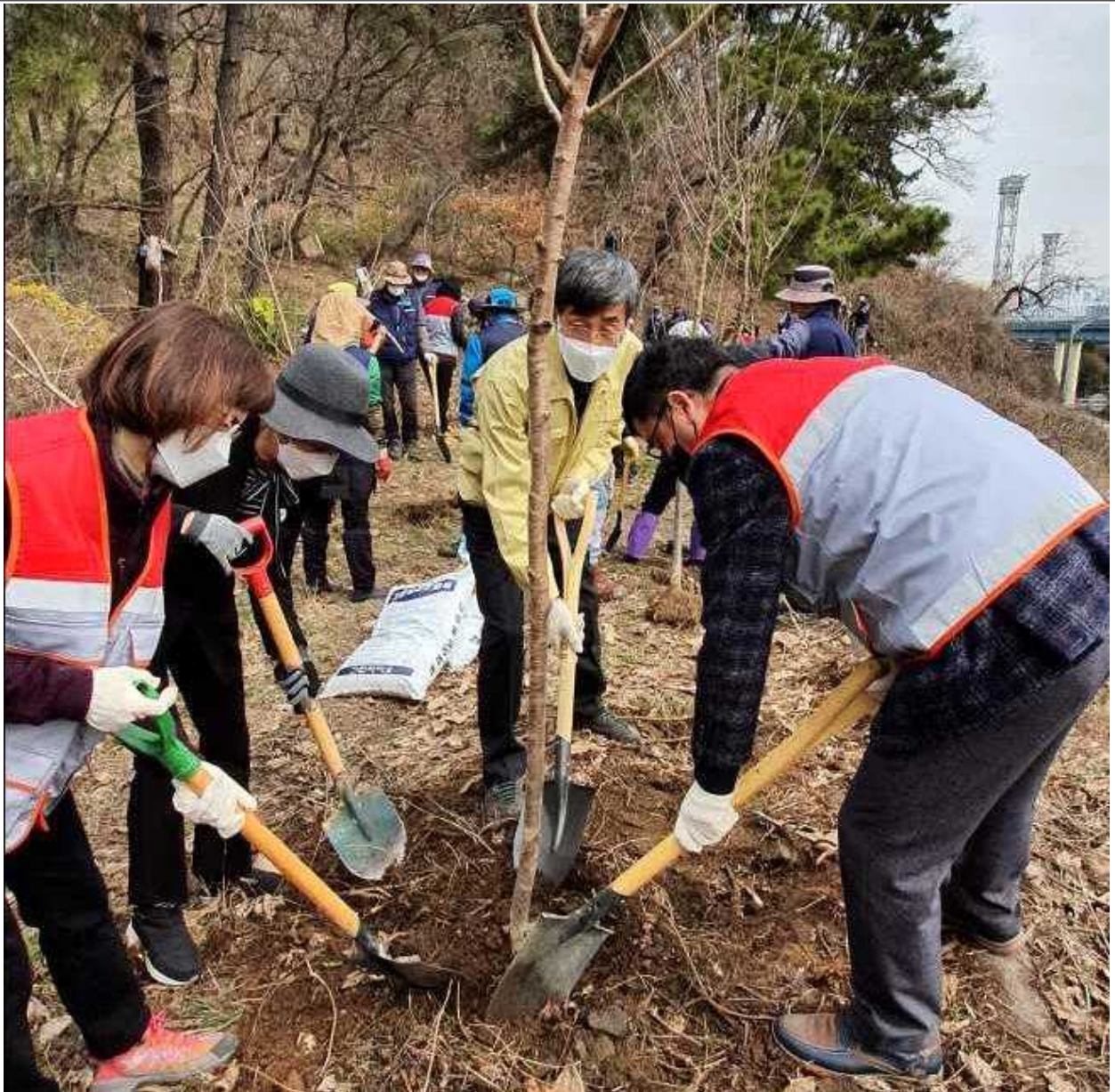
월미공원 식목일 나무심기 현황사진