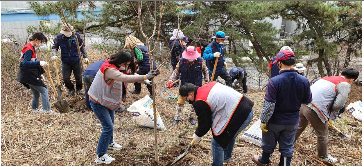
월미공원 식목일 나무심기 현황사진