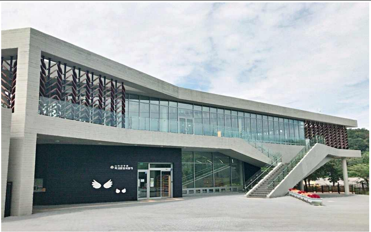
- 목재문화체험장 전경