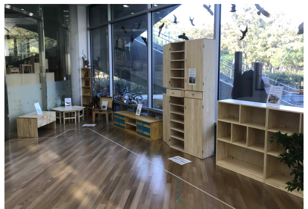
- 가족참여 목공체험