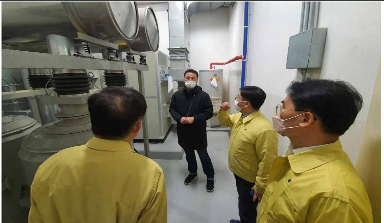
대청2호 주민대피시설 내부(비상발전기)