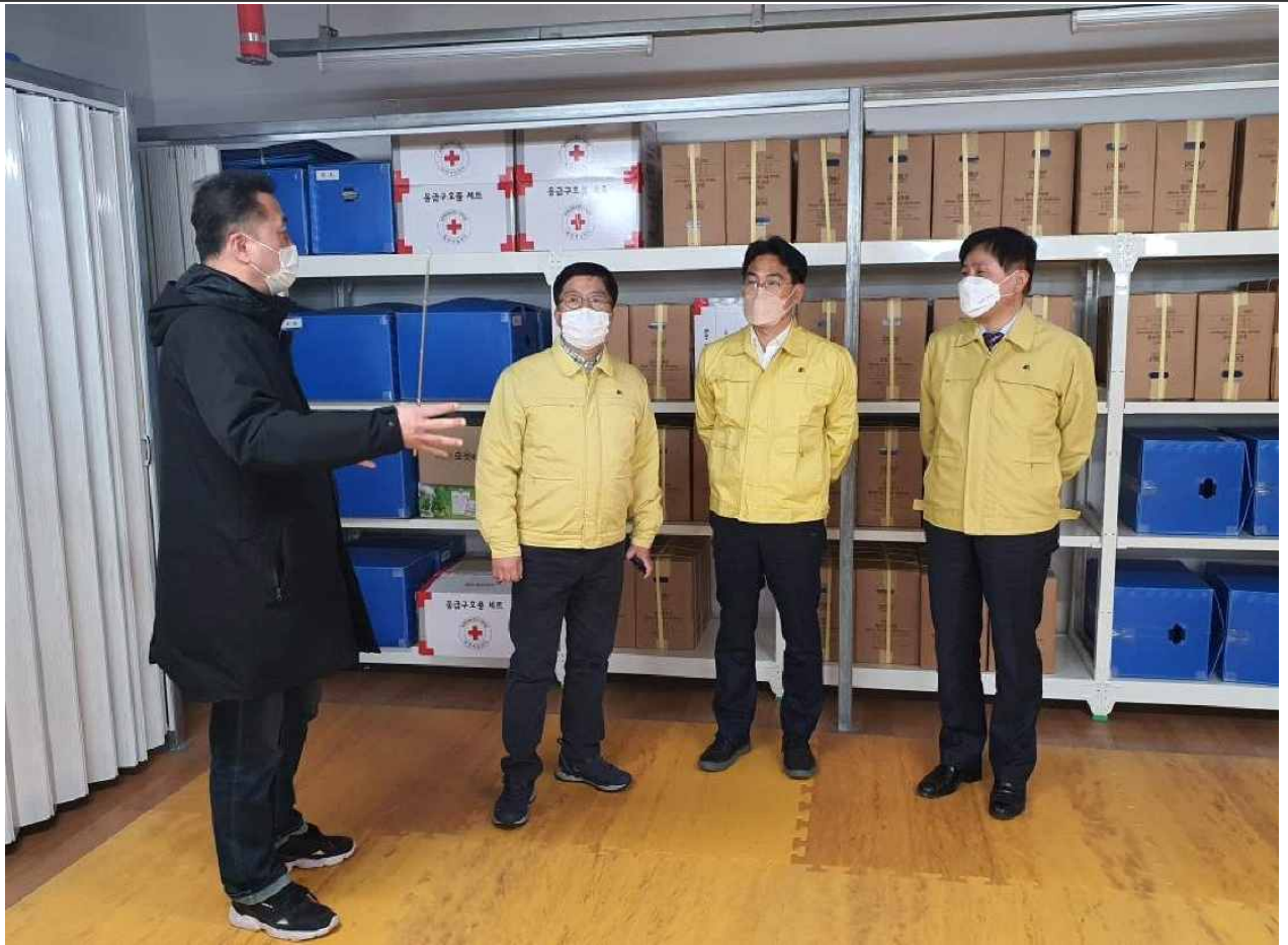
대청2호 대피시설 내부(비치물품 보관창고)