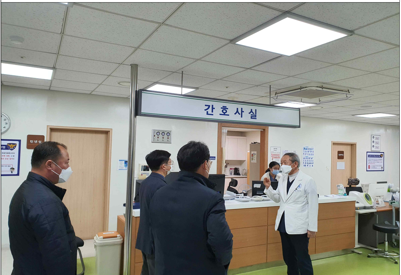
백령병원 의료현장 점검