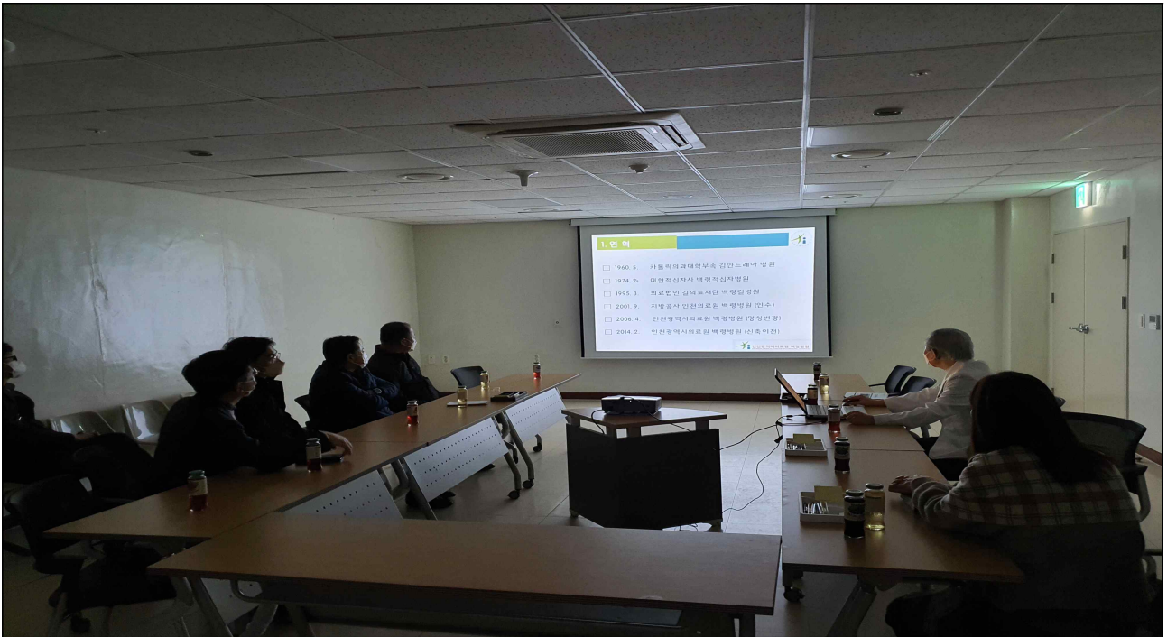
백령병원(원장: 이두익) 간담회