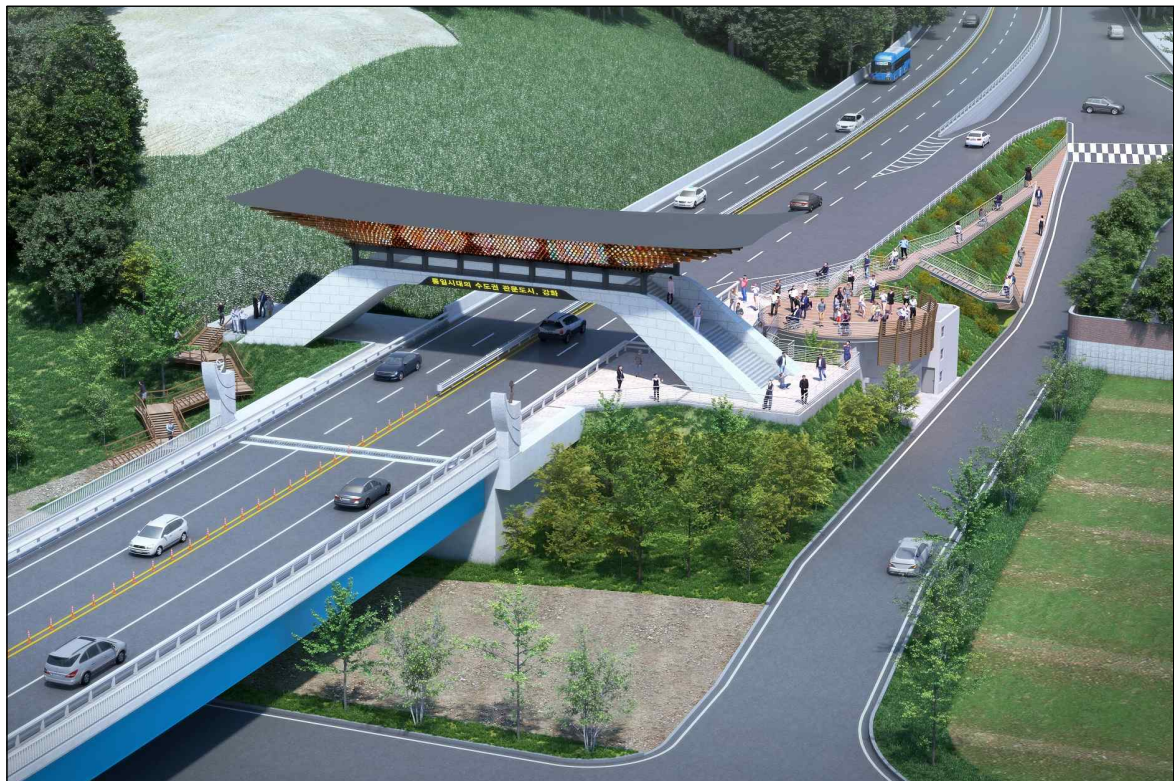
공공디자인위원회 심의 통과