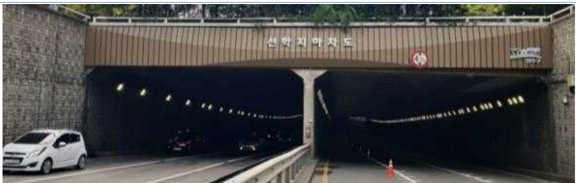
개선 후 (주간)