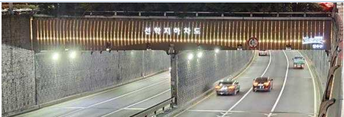
개선 후 (야간)