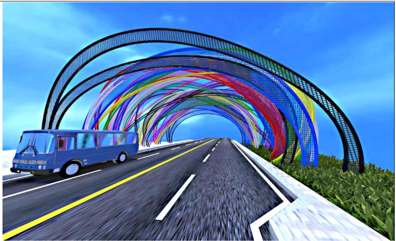
공공디자인위원회 심의 부결