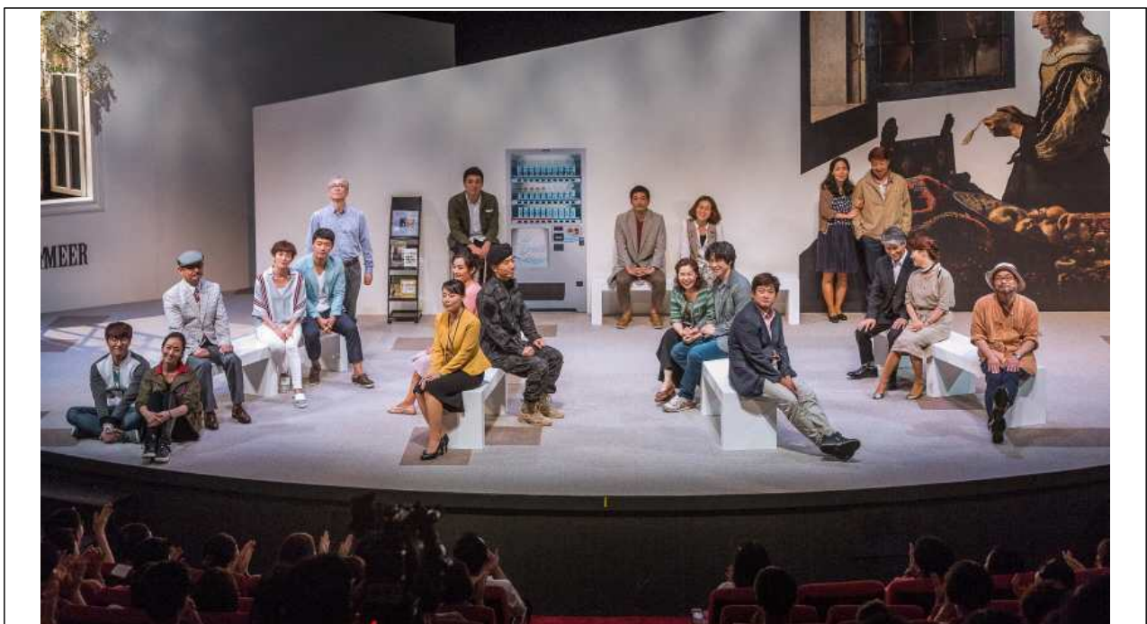
인천시립예술단 공연 사진