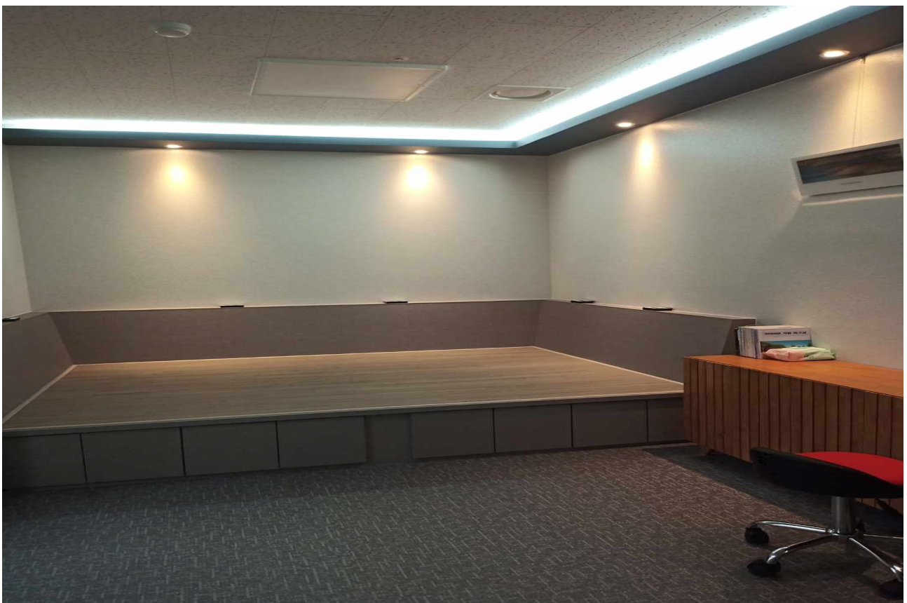
<여성휴게실 환경개선사업 완료 사진>