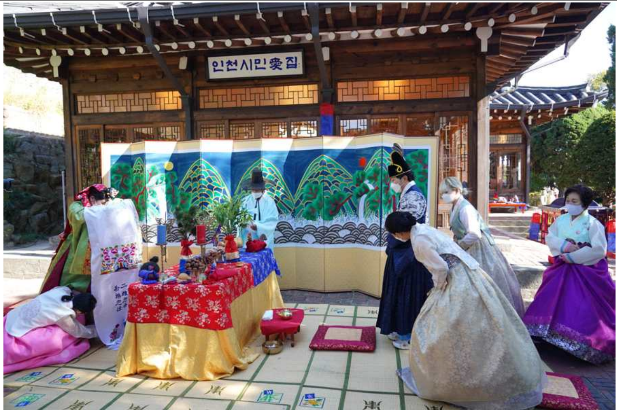
2021년 행사 사진 (한복패션쇼) ↓