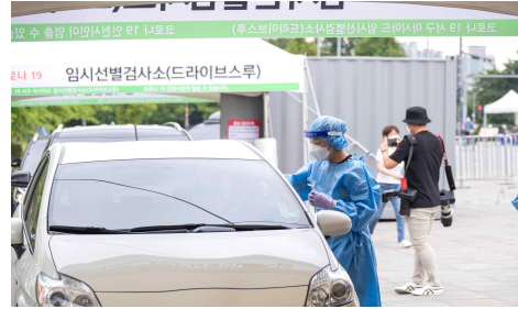
< 연수구 임시 선별검사소, 서구 아시아드 주경기장 임시 선별검사소 사진 >