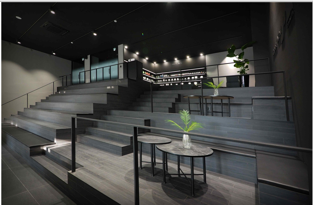
(주)JPS코스메틱 접견실(2021 인천의 아름다운 공장 중)