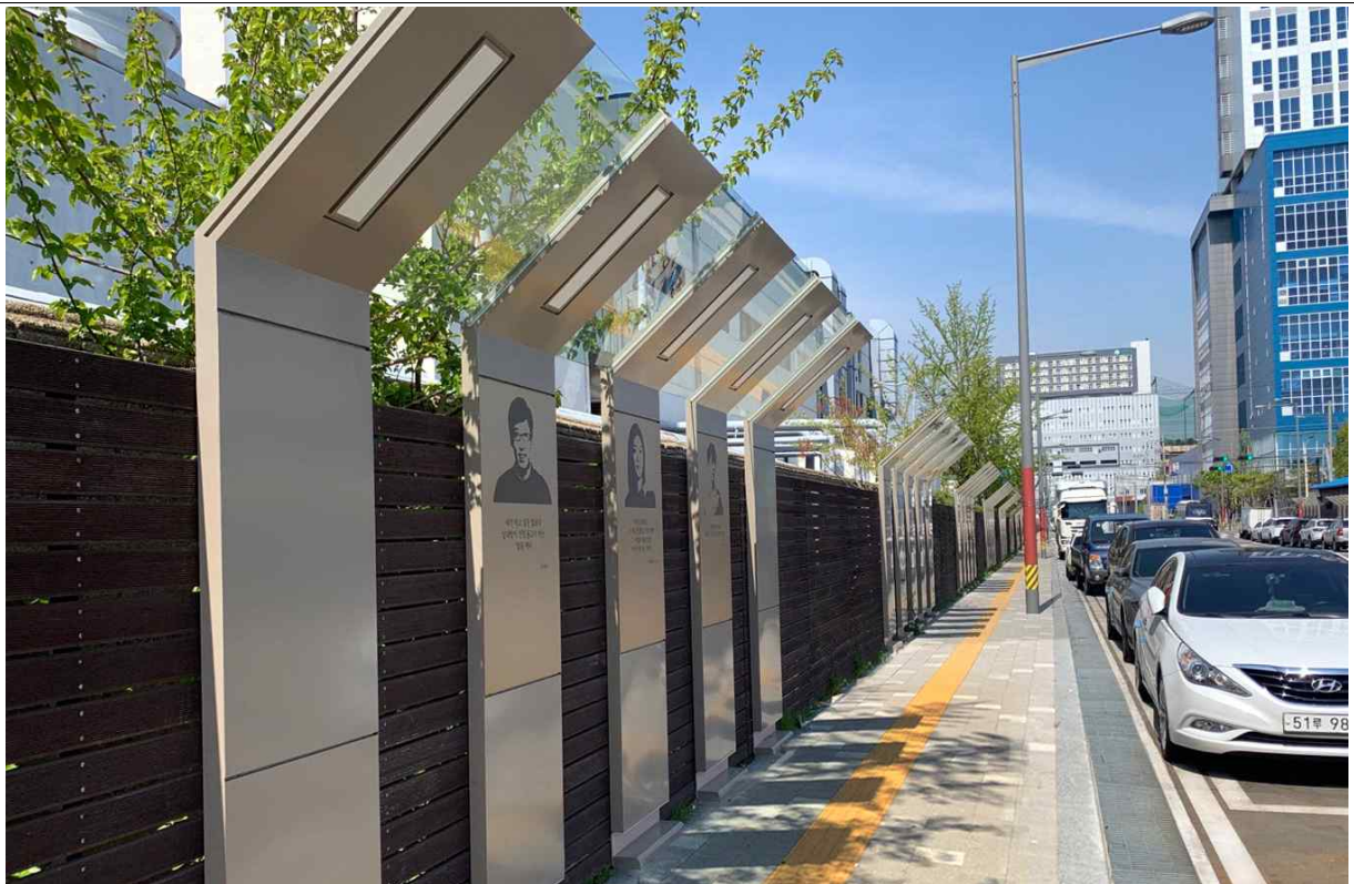
아름다운 거리 조성사업(2021 주안국가산업단지)