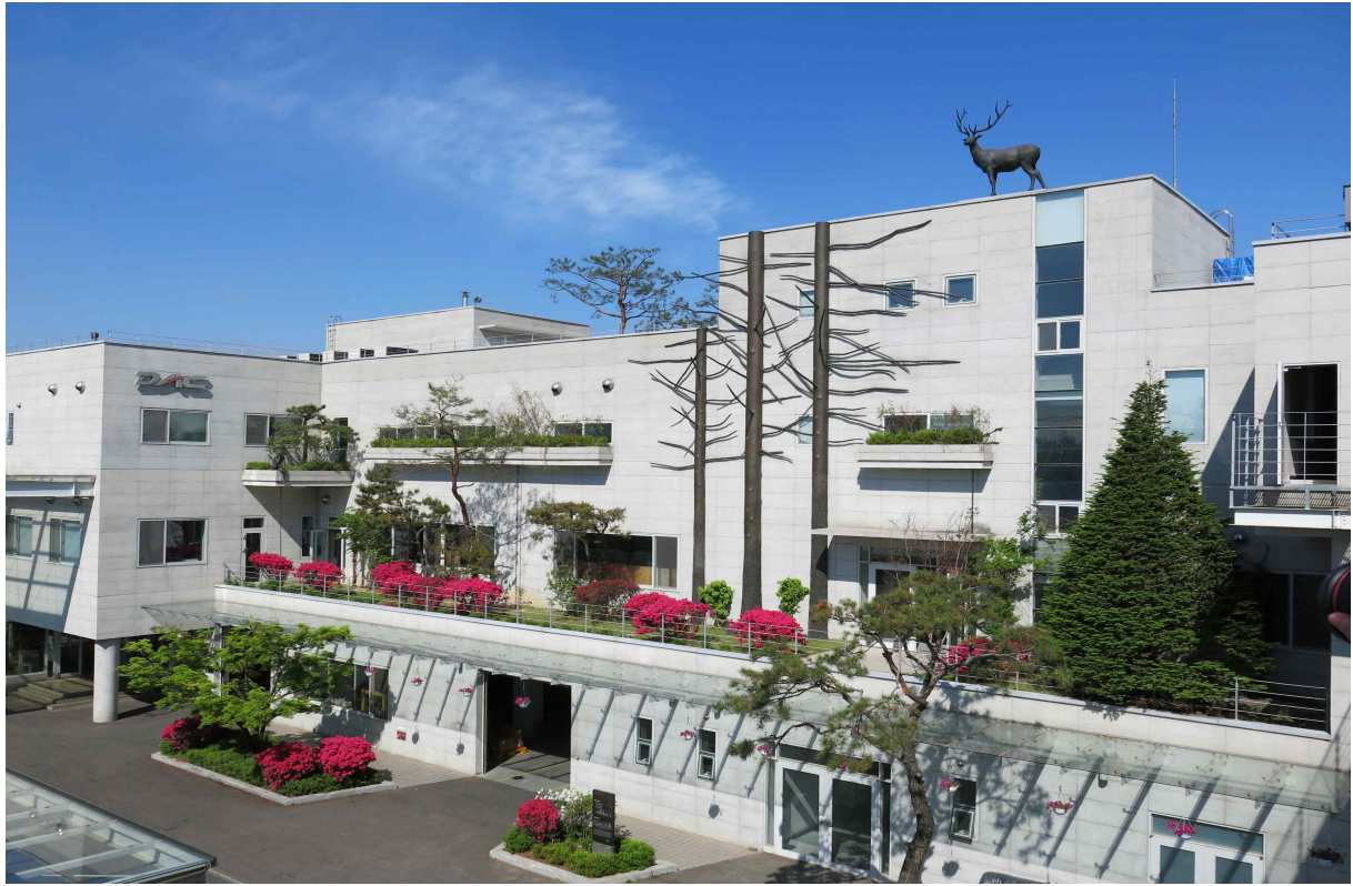
동아알루미늄(주) 공장전경 (2016 인천의 아름다운공장 중)