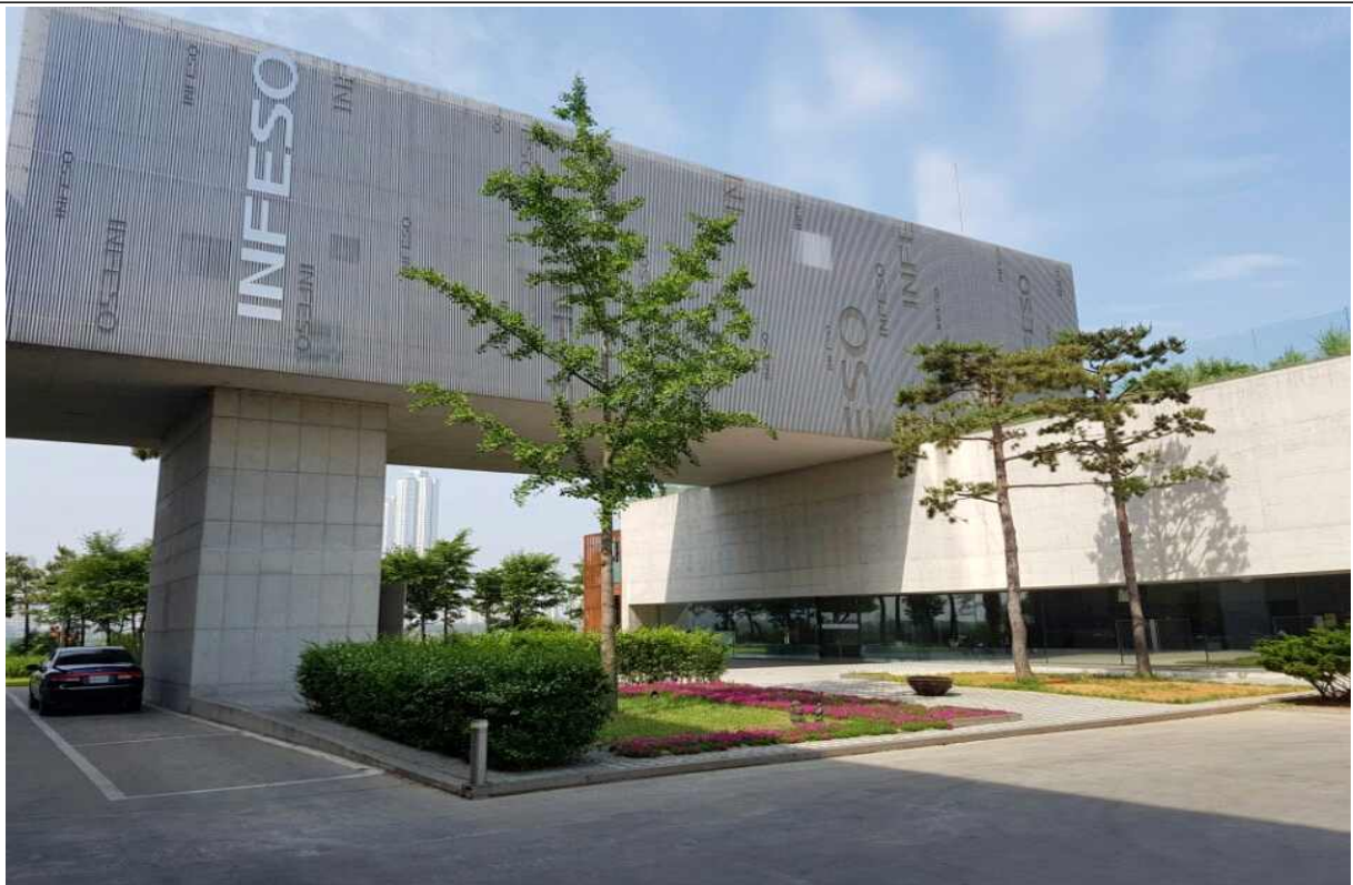
(주)인페소 공장전경 (2016 인천의 아름다운공장 중)