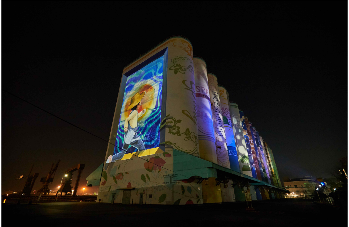
사일로 미디어파사드 (2020)