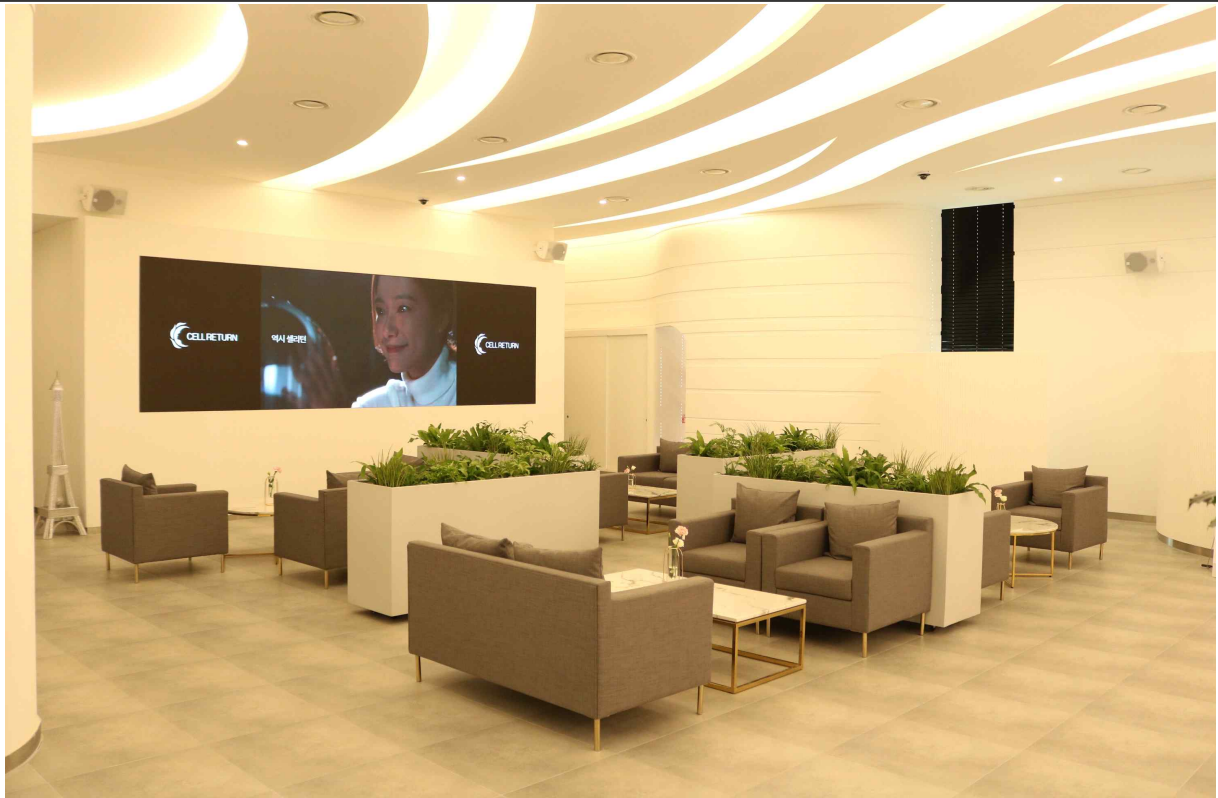
(주)셀리턴 쇼룸(2020 인천의 아름다운공장 중)