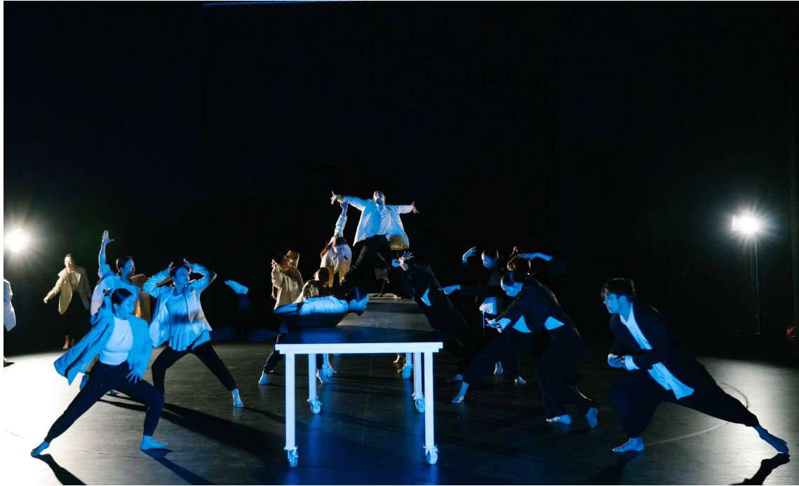
워터캐슬 공연 이미지