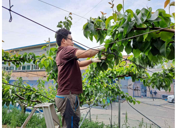
배 적과 작업