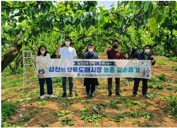
농촌 일손 돕기 사진