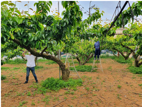
배 적과 작업