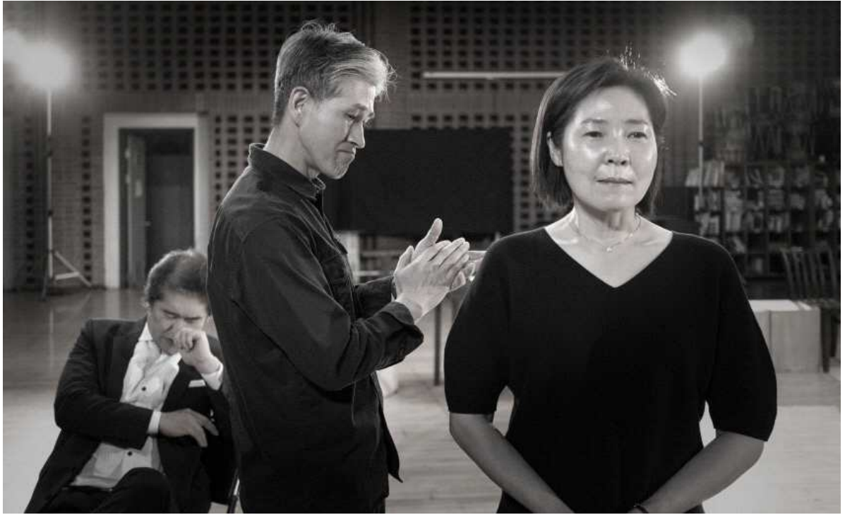
〈다스 오케스터〉 이미지