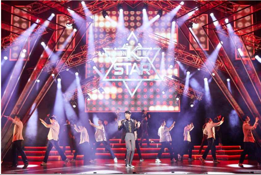
<블루헬멧:메이사의 노래> 이미지