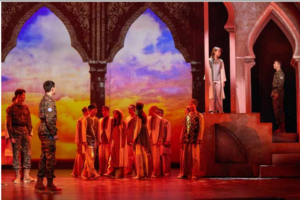
<블루헬멧:메이사의 노래> 이미지