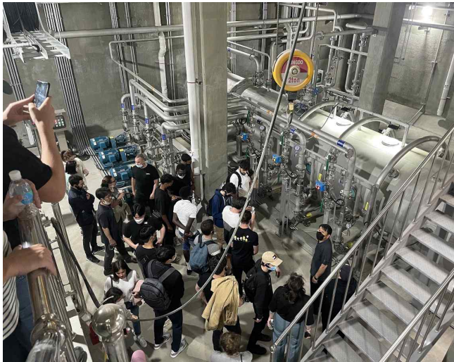
▲ 부평정수장 현장 견학