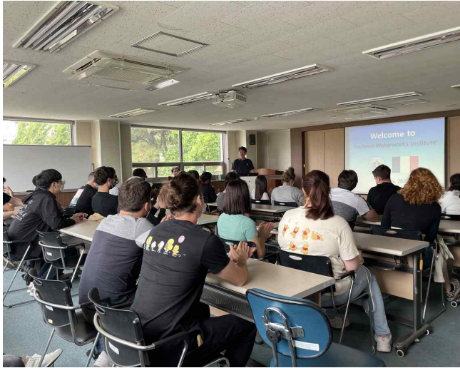
▲ 인천시 상수도 현황 소개