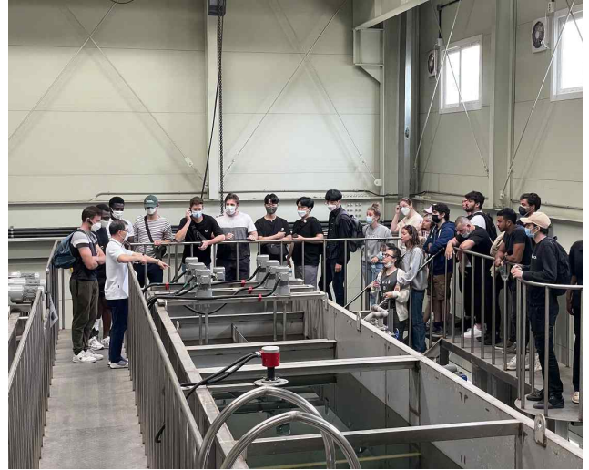
▲ 맑은물연구소 시험동(pilot plant) 견학