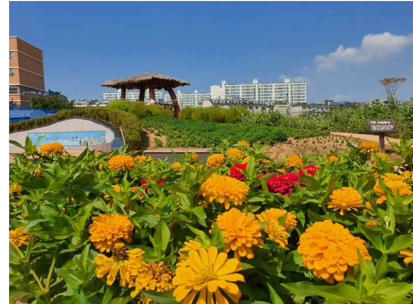
<붙임> 관련 사진

참고하거나, 도시농업교육팀(☎032-440-6947)으로 문의하면 된다.