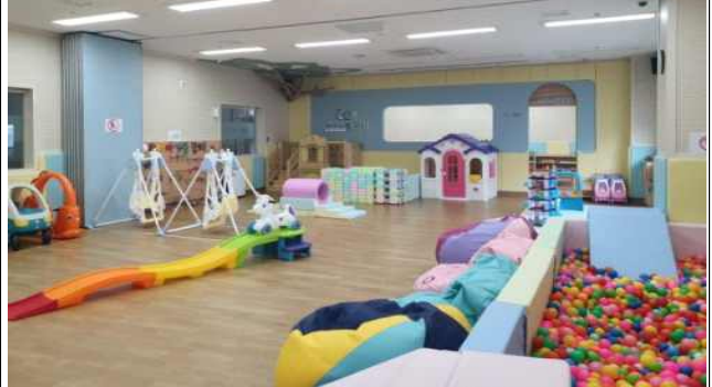
동구 1개소 (사진 동구 1호점)