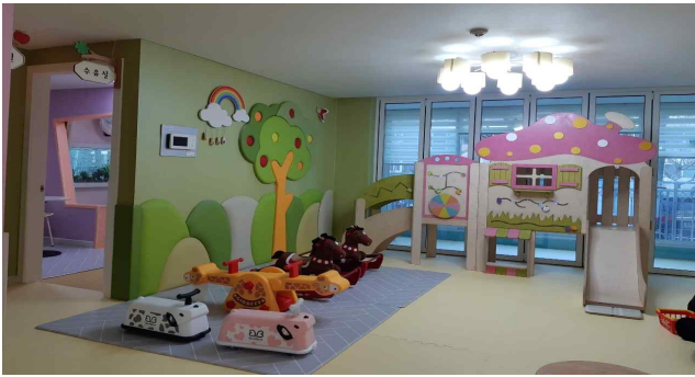
중구 2개소 (사진 중구 1호점)