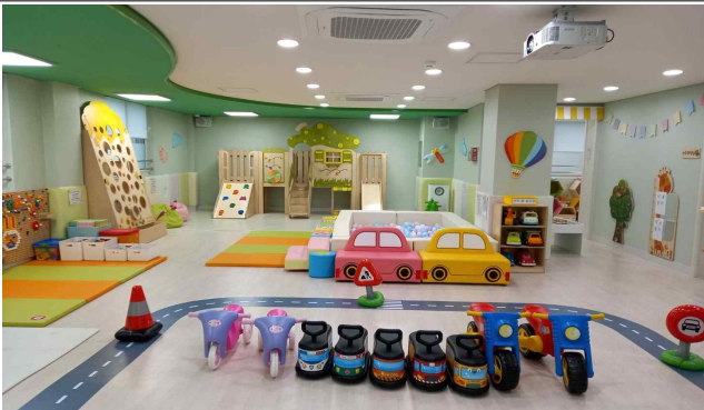
계양구 3개소 (사진 계양구 1호점)