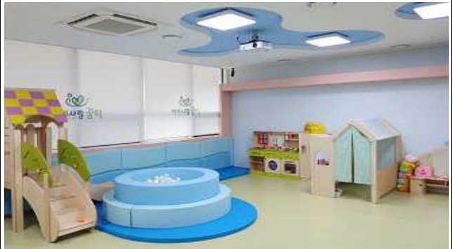
연수구 6개소 (사진 연수구 2호점)