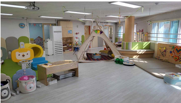
남동구 9개소 (사진 남동구 2호점)