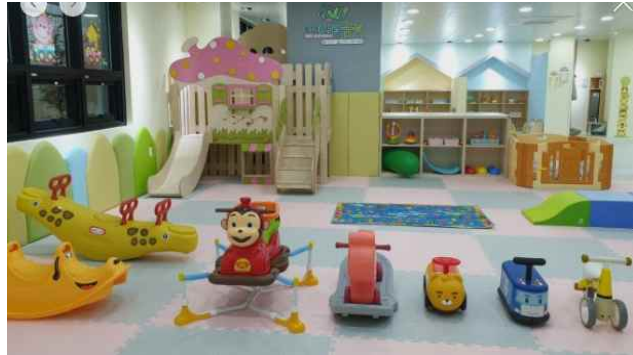
미추홀구 4개소 (사진 미추홀구 4호점)