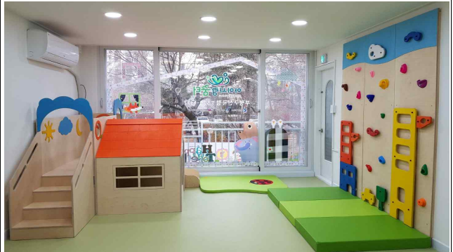
부평구 2개소 (사진 부평구 1호점)