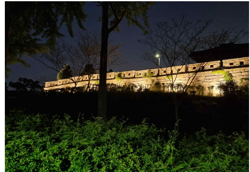
<사진> 월미공원 야간경관 개선사업 사진

김천기 시 월미공원사업소장은 “월미권역 관광활성화를 위해 야간명소로 거듭난 월미공원의 볼거리와 다양한 체험, 월미도의 먹거리와 즐길거리가 어우러져 시너지 효과를 내기를 바란다.”고 말했다.