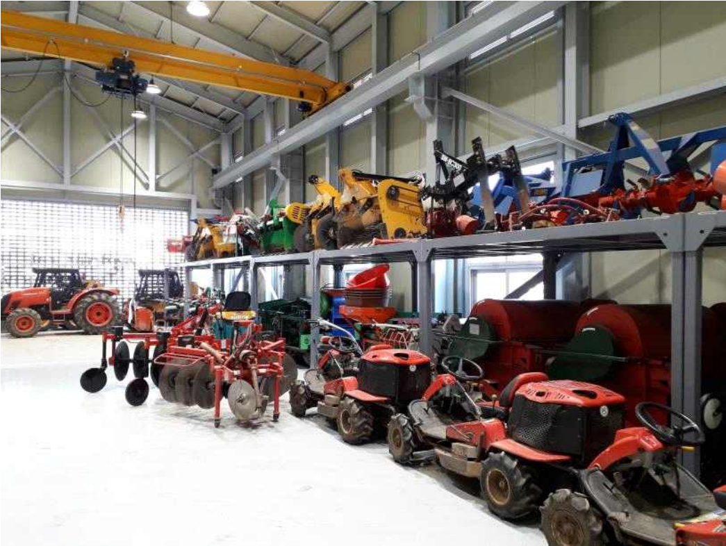
<붙임 2> 트랙터 농기계 임대