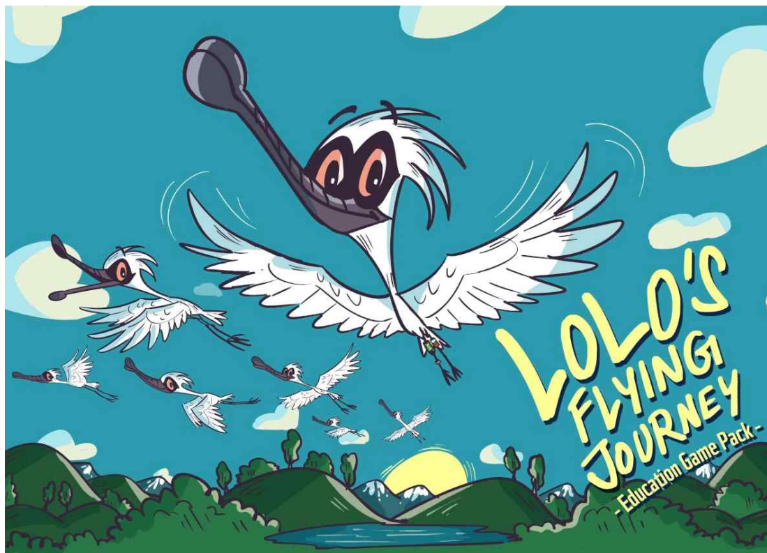
저어새 교구 '롤로의 비행'