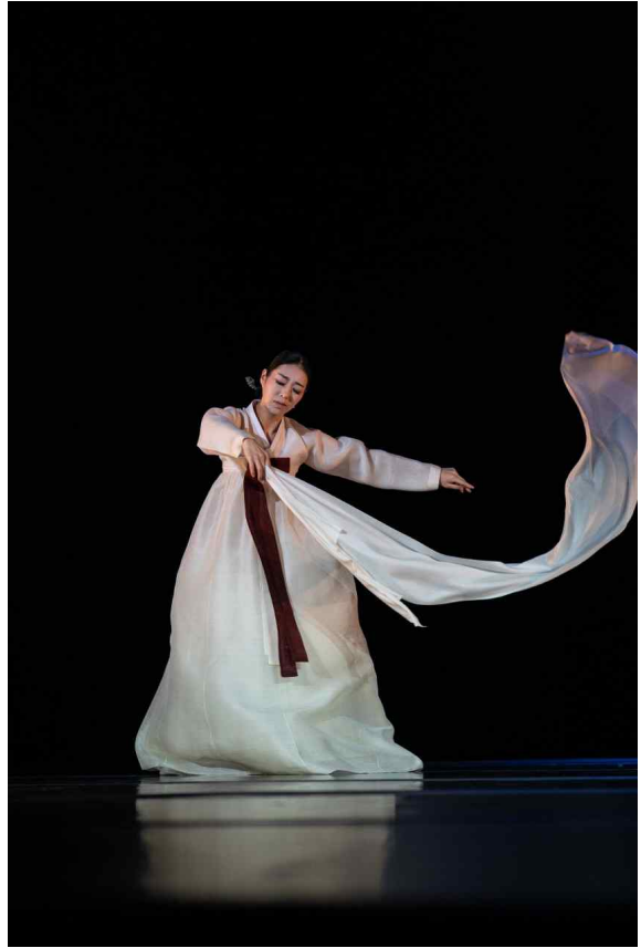
인천시립무용단 공연 사진