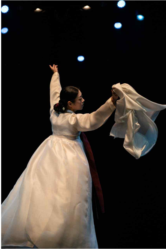
인천시립무용단 공연 사진