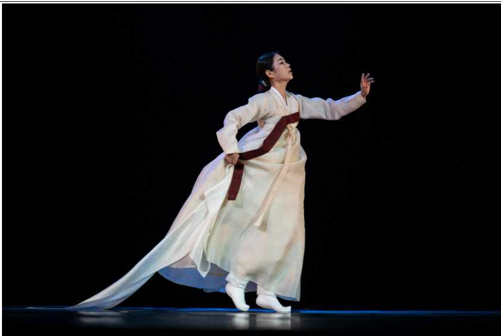
인천시립무용단 공연 사진