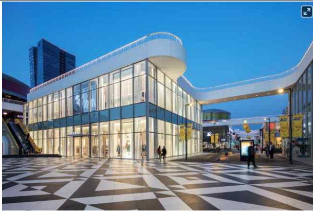
트리플 스트리트(연수구, 2017)