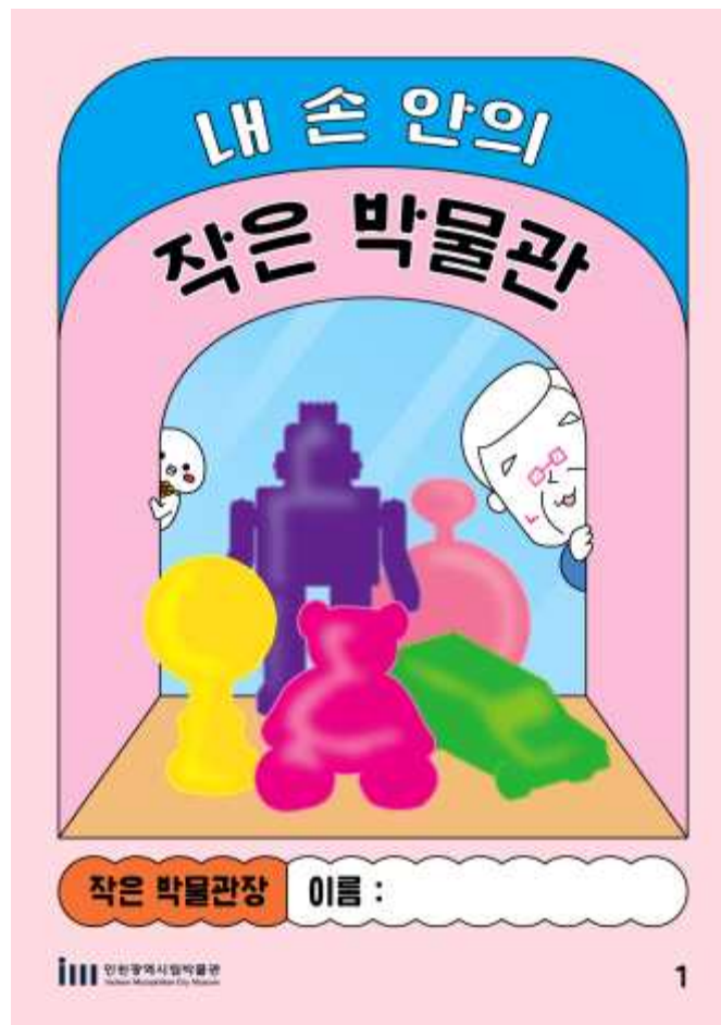
<미니북, 내 손안의 작은 박물관>

프로그램 신청은 인천시립박물관 홈페이지( www.incheon.go.kr/museum )에 서 할 수 있다. 문의: 032-440-6738